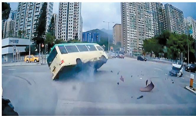
從攝錄鏡頭畫面中可見，專線小巴被撞後失控掉頭及翻側。太平門逐一救出，分批送往兩間醫院救治。

消防處動員65人，派出9輛消防車和10輛救護車到場展開救援，當時小巴內兩人被困，包括小巴司機上半身拋出車窗外，當場證實不治，其餘傷者由消防打開車尾