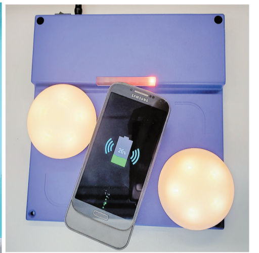
應科院供智能家居和辦公室使用的共振式無線充電器(紫色底座)，可同時為手機、手提電腦、燈泡等充電。