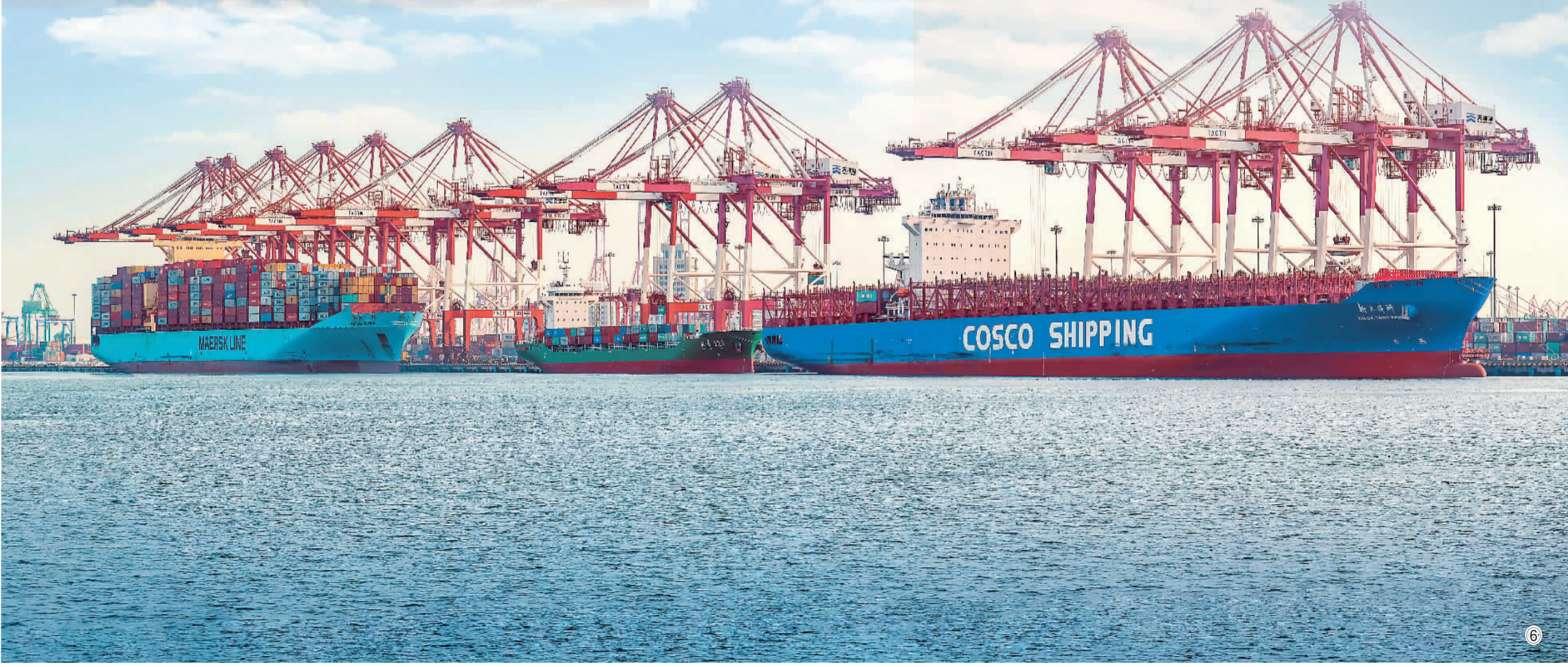
图①：广东佛山市顺德区中铁华隧联合重型装备有限公司生产车间内，工人正在赶制订单。 图②：国产最大直径盾构机“京华号”吊装入井。 图③：位于河北张家口市的吉利集团领克工厂焊装车间。 图④：联想集团合肥联宝科技智能主板生产线上的自动化生产设备。 图⑤：东风汽车零件车间操作人员正在进行质量自查。 图⑥：繁忙的天津港。