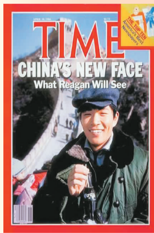
1984年4月30日的《时代》周刊封面，一个普通中国人手拿可口可乐。标题为“中国的新面貌，里根将会看到什么？”