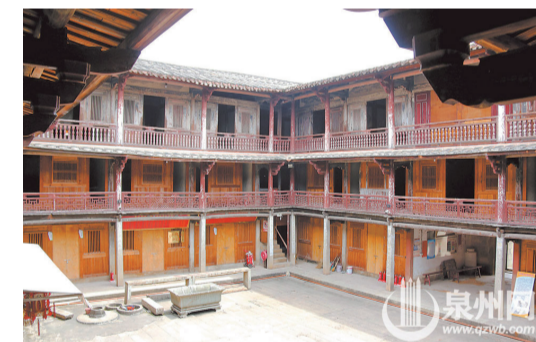
▲聚奎樓是保存較好的土樓之一