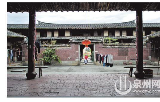
▲巽來莊土樓內的大厝一角