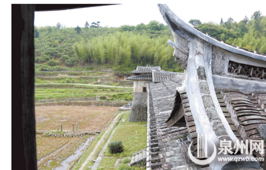
▲厚德堡土樓造型奇特，十分精美