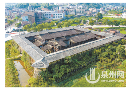
▲大興堡土樓的外圍已經修繕