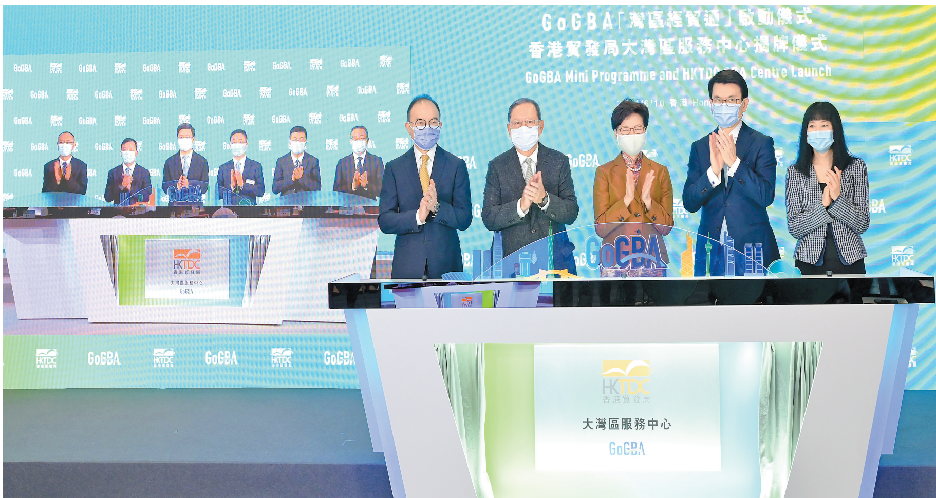
貿發局聯同廣東省相關部門推出GoGBA一站式平台，支持港商融入粵港澳大灣區。政府新聞網