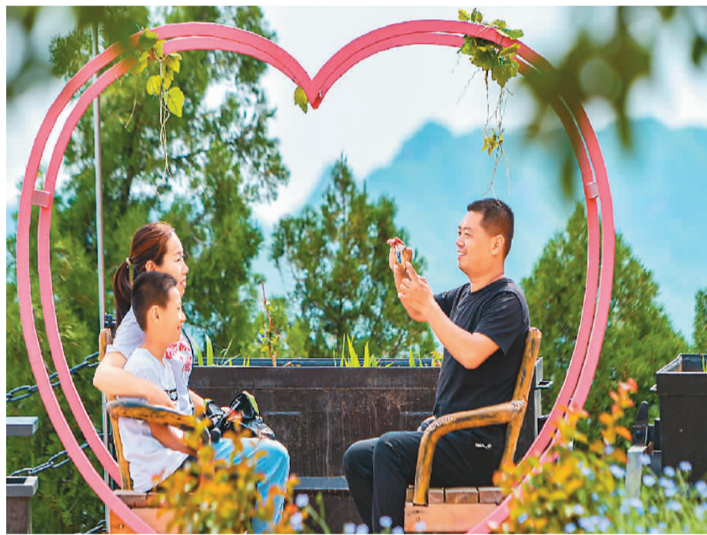
游客在河北省邯郸市磁县天保寨景区游玩。

人们不再满足于常规的出游内容,尤其家庭游更热衷带孩子体验中国传统文化习俗,例如孩子们在