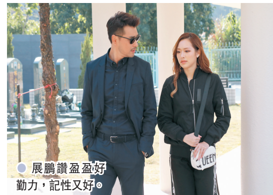
●展鵬讚盈盈勤力，記性又好。

城城今次到澳門開騷也是由大會籌辦之《巨星專屬舞台系列盛事》活動之一，他透露演唱會團隊已經開始創設全新晉級版的嶄新舞台和經典曲目流程，期待以最頂級的舞台視覺效果及破格造型之歌舞演繹，為觀眾送上亮麗而不暇給的全新個人演唱會。