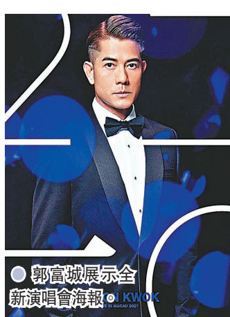
●郭富城展示全新演唱會海報。