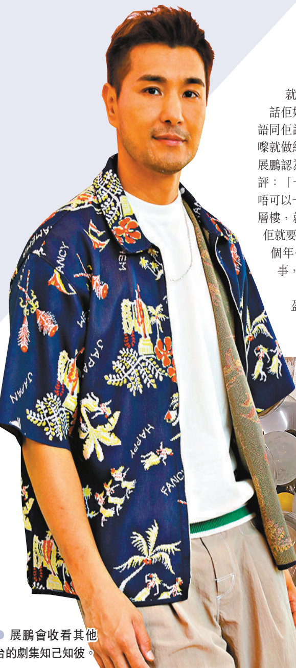
●展鵬會收看其他台的劇集知己知彼。

香港文匯報訊 (記者 梁靜儀) 「視帝」陳展鵬相隔三年再有劇集播出，主演的《逆天奇案》自播出以來收視及口碑都不俗，劇集更成為上半年兩線劇集單集收視冠軍，日前就接受香港文匯報專訪，大談拍劇的苦與樂，以及對手馮盈盈令他有無形壓力，因對方好勤力，記性又好，講對白快到他接不住。展鵬又稱作為這個年代的演員，要與時並進。