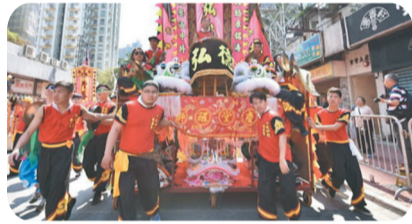
●香港天后誕巡遊。網上圖片