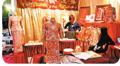
●中式長衫和裙褂。網上圖片