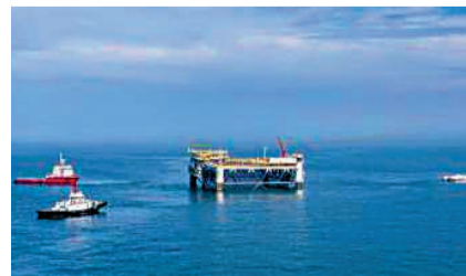
亞洲最大深海智能網箱平台「經海001號」(圖)近日拖帶至煙台長島南陸城東部海域投入使用，目前已投放20萬尾魚苗。該網箱平台為坐底式網箱平台，水深約32米，包圍水體約7萬立方，可養殖魚類600噸至700噸。●中新社

首趟檢測列車10日從牡丹江站開出，一路向北駛向佳木斯方向，標誌中國在建東端的高寒高鐵——牡(丹江)至佳(木斯)高速鐵路聯調聯試正式啟動，全線進入工程驗收階段，為今年秋季全線開通運營奠定基礎。●中新社