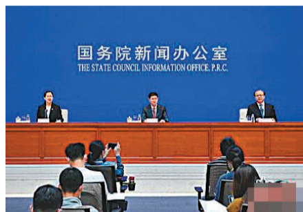
●6月10日，國務院就第五批國家級非物質文化遺產代表性項目名錄有關情況舉行政策例行吹風會。網上圖片

國家級非物質文化遺產代表性項目名錄是《中華人民共和國非物質文化遺產法》確定的非物質文化遺產保護基本制度，也是中國履行《保護非