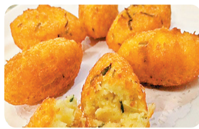
●葡人美食馬介休。網上圖片