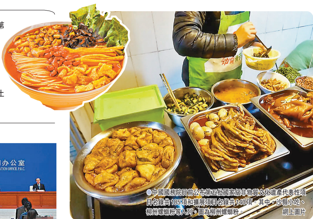
●中國國務院日前公布第五批國家級非物質文化遺產代表性項目名錄共185項和擴展項目名錄共140項。其中，沙縣小吃、柳州螺蛳粉等入列。圖為柳州螺蛳粉。

香港文匯報訊 綜合報道，中國國務院日前印發《關於公布第五批國家級非物質文化遺產代表性項目名錄的通知》，公布第五批國家級非物質文化遺產代表性項目名錄共185項和擴展項目名錄共140項。其中，沙縣小吃、柳州螺蛳粉等一批服務民生、惠及百姓的非遺項目入列。另外，香港中式長衫製作技藝、香港天后誕，澳門特別行政區申報的土生土語話劇、土生葡人美食烹飪技藝和澳門土地信俗等5個項目全部列入名錄。