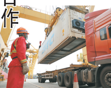
●圖為早前一輛貨車在大連港大連集裝碼頭有限公司港口裝載貨櫃。資料圖片

同日，中國商務部舉行的例行發布會上，新聞發言人高峰表示：中美作為全球兩大主要經濟體，經貿關係的本質是互利共贏。雙方在經貿領域都有各自重要關切，但在相互尊重、平等相待的基礎上，可以通過對話協商來探討解決之道。最近一段時間，劉鶴副總理與戴琪大使和耶倫財長分別通話。今天(10日)早上，商務部部長王文濤與美國商務部部長雷蒙多通話。雙方經貿團隊保持溝通，如有進一步情況，會及時發布。