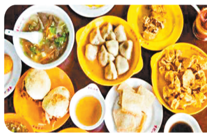
●沙縣小吃蒸餃、拌麵和雲吞等。網上圖片