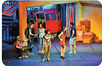
●澳門土生土語話劇。網上圖片

此次國務院公布新一批國家級非物質文化遺產代表性項目名錄，是貫徹落實習近平新時代中國特色社會主義思想的重要體現，對進一步推動國家級非物質文化遺產代表性項目名錄體系建設、加強非物質文化遺產系統性保護水平、推動非物質文化遺產保護意識深入人心具有重要意義；有利於推動經濟社會發展和服務國家戰略，有利於增強中華優秀傳統文化的生命力和影響力，推動中華優秀傳統文化創造性轉化、創新性發展。各地區、各部門要堅持以社會主義核心價值觀為引領，貫徹「保護為主、搶救第一、合理利用、傳承發展」的工作方針，切實提升非物質文化遺產系統性保護水平，為實現中華民族偉大復興的中國夢提供強大精神力量。