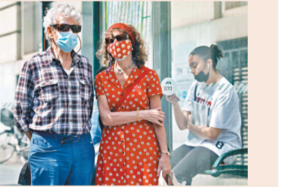
●歐洲民眾對美國觀感大不如前。

歐洲年輕一代反而更看好中國，在回答「如何看待中國在全球事務中的影響力」這問題時，18至24歲年齡層的歐洲年輕人對中國普遍持正面評價，同一年齡層的美國年輕人也有61%對中國持正面評價。