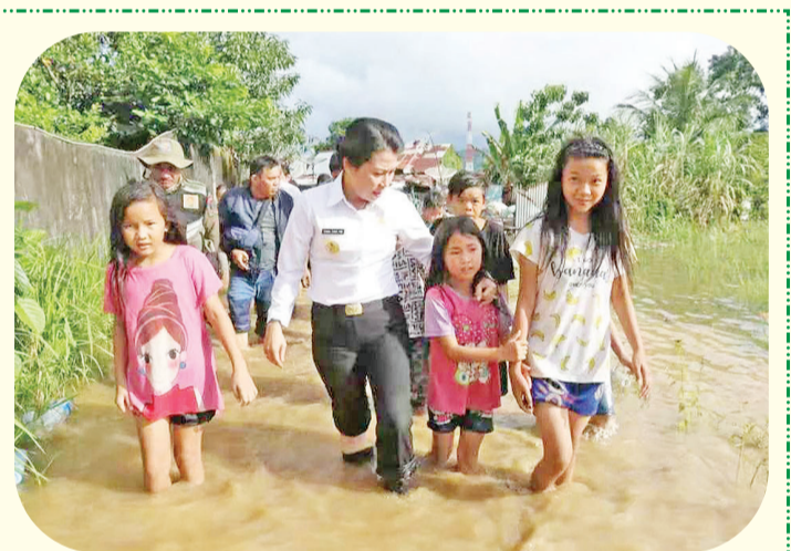
蔡翠媚市长在山口洋农村察看水灾灾情，并亲自护送儿童到安全的地方。

蔡翠媚上任后，一方面致力于城市管理，关注民生，一方面继续不遗余力地向中央政府交通部门申请资金，坚持推动兴建机场的目标。