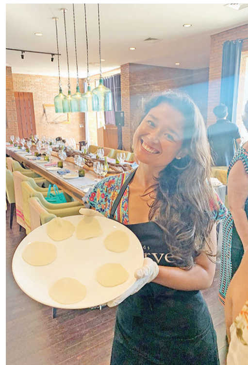
学员展示自擀的饺子皮