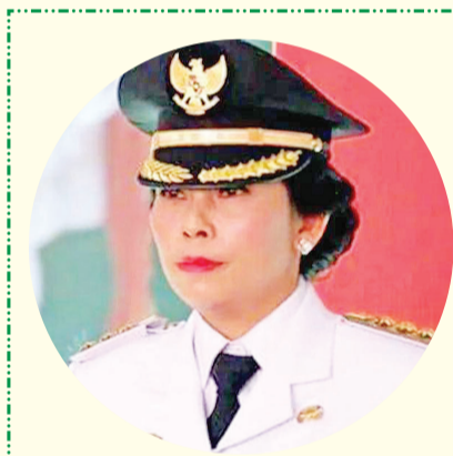
2017年3月，身着市长制服的蔡翠媚在山口洋市政府宣誓就职。

自己开车，单程跑一趟，最快也要三个半小时，中途还要在百富院或松柏港小镇歇脚，喝杯咖啡，吃块印尼糕。