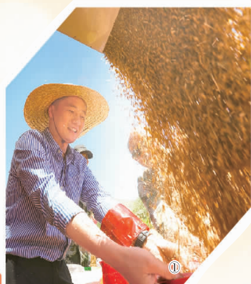
千里沃野，麦浪滚滚，机声隆隆，今年夏粮丰收在望，我们又将迎来一个沉甸甸的丰收季。

农为邦本，本固邦宁。习近平总书记强调：“对我们这样一个有着14亿人口的大国来说，农业基础地位任何时候都不能忽视和削弱，手中有粮，心中不慌在任何时候都是真理。”“确保国家粮食安全，把中国人的饭碗牢牢端在自己手中。”