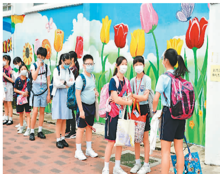
香港新冠肺炎疫情缓和,中小学课堂大致恢复正常。图为香港小学生等候进入校园。

杨润雄表示,公民科旨在让学生通过学习香港、国家和当代世界的相关议题,建立坚实和广阔的知识基础,培养慎思明