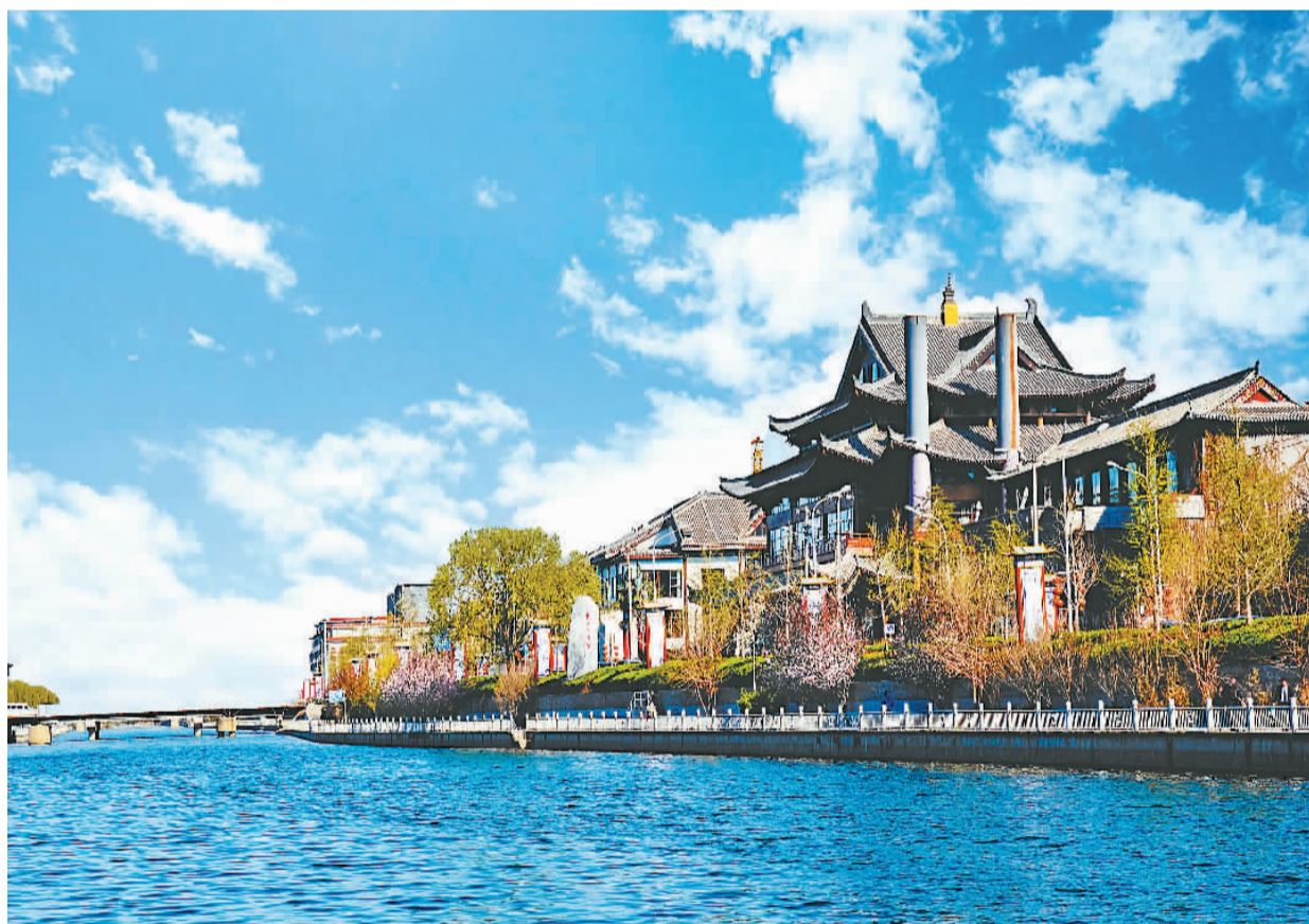
如今,高碑店乡已成为文化创意产业园聚集地。图为通惠河畔文化创意产业园,多家从事教育信息化的企业落户于此。

“ㄅ(b)、ㄆ(p)、ㄇ(m)、ㄌ(l),这些拼音就是我在识字班学的。”85岁的周振兴戴上老花镜,仔细摩挲着记者递给他的人日报老报纸。