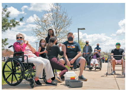
●美國民眾早前在路邊等候打針。

有見海外僑民接種難，不少海外美國人組織近日紛紛聯署，呼籲華府提供疫苗。民主黨海外分部一眾領袖上周二便向