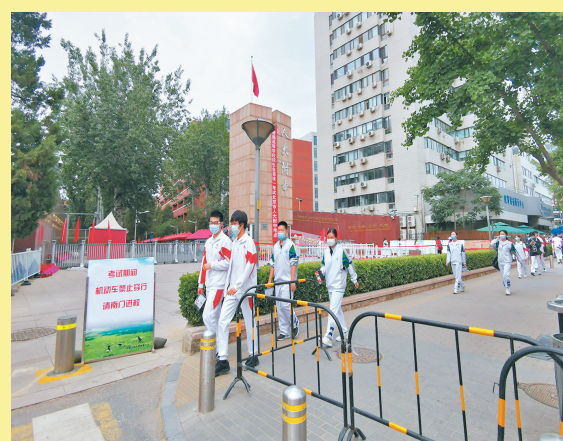
●高考語文考試結束後，北京人大附中考點的考生走出考場。