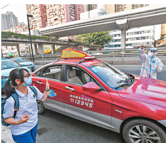
●一名考生到達目的地後和專車司機說再見。

7日清晨，在校方的協調下，由廣交集團安排的出租車出發前往位於廣州幹部健康管理中心的隔離點接送考生。該通車經過全面消毒，司機也已接種過兩劑新冠疫苗。車內溫度舒適。接到考生後，出租