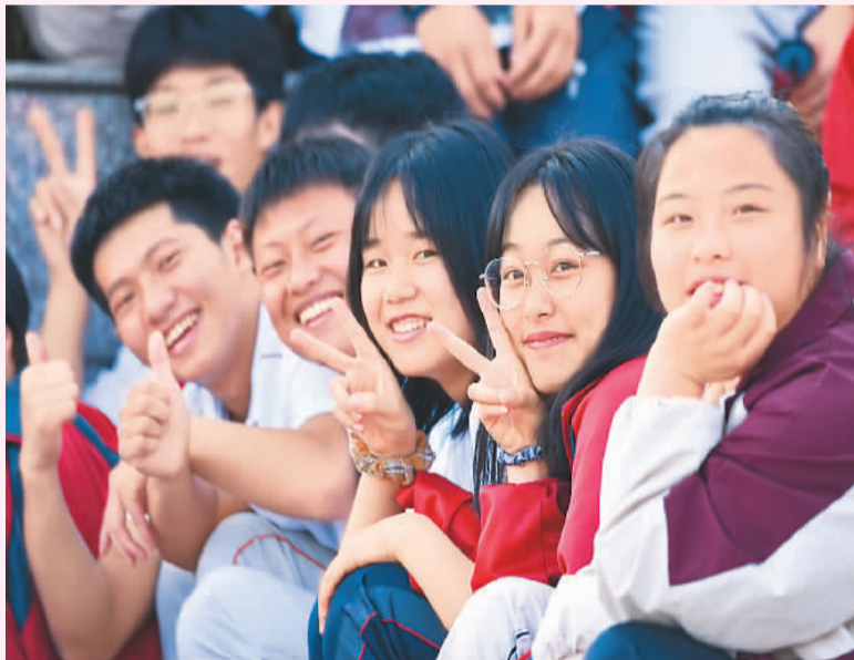
▲ 6月7日,在贵州省铜仁市松桃苗族自治县民族中学考点,考生放松心情迎考。