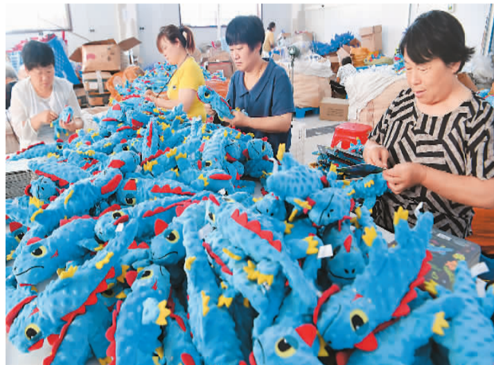
六月六日,在安徽省亳州市谯城区古城镇 田杰玩具厂,工人在赶制宠物玩具产品出 订 单。 该企业产品主要销往美国、欧洲等 外 市场。

中,自动数据处理设备及其零部件6122亿元,增长20.4%;手机3548.7亿元,增长28.8%;汽车(包括底盘)表现尤其抢眼,出口756.7亿元,增长95.8%。同期,出口劳动密集型产品1.42万亿元,增长22.4%,占17.6%。