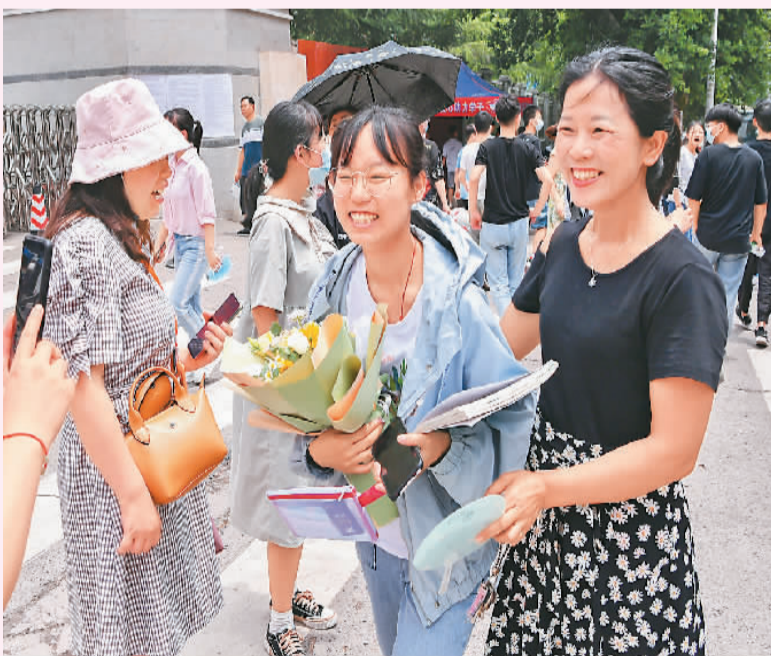
▼ 6月7日11时55分,在四川广安二中考场外,一位陪考家长将寓意“一举夺魁”的向日葵花送给走出考点的孩子。