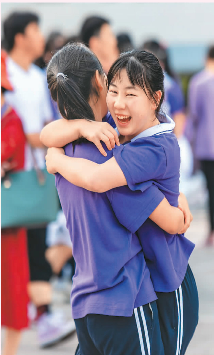
▲ 6月7日,在湖北省宜昌市秭归县一中考点,两名女生相拥加油鼓劲。

6月7日,2021年高考拉开帷幕。全国1078万考生赶赴考场,迎接人生路上的一次大考。