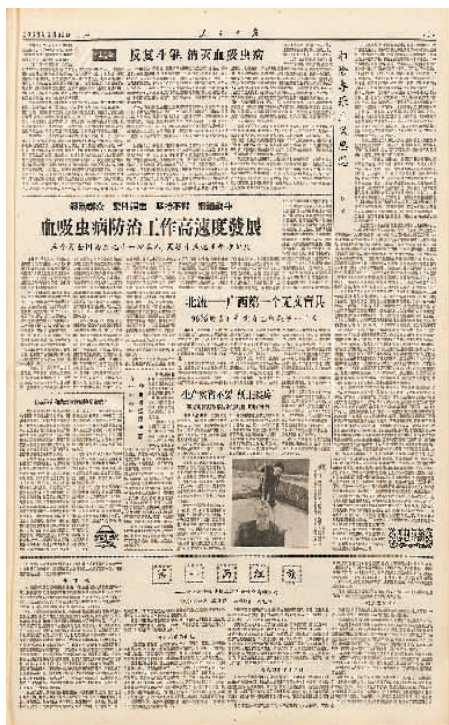
1958年6月30日出版的人民日报第七版。