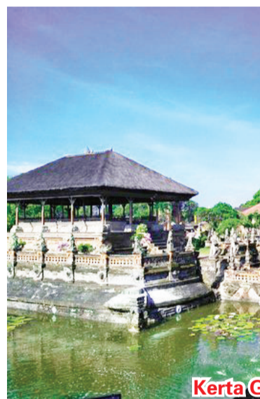
Kerta Gosa 宫廷

13. 顶画日历古代生活场景 Kerta Gosa 宫廷 (建议停留时间 60 分钟)