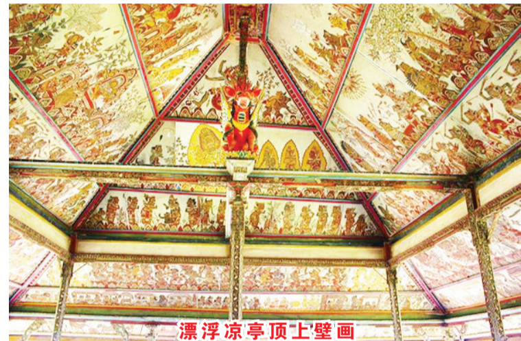
漂浮凉亭顶上壁画

离宫廷大致5分钟车程也可顺便去 Unda 河 (Unda River)，巨大的水坝目前可看到一些当地人在流水前大摆姿势；或者继续艺术之旅前往已故巴厘艺术大师 Nyoman Gunarsa 的私人画廊博物馆。此成立于1990年博物馆收藏了 Gunarsa 大师生前包括绘画、雕塑和古董古典和