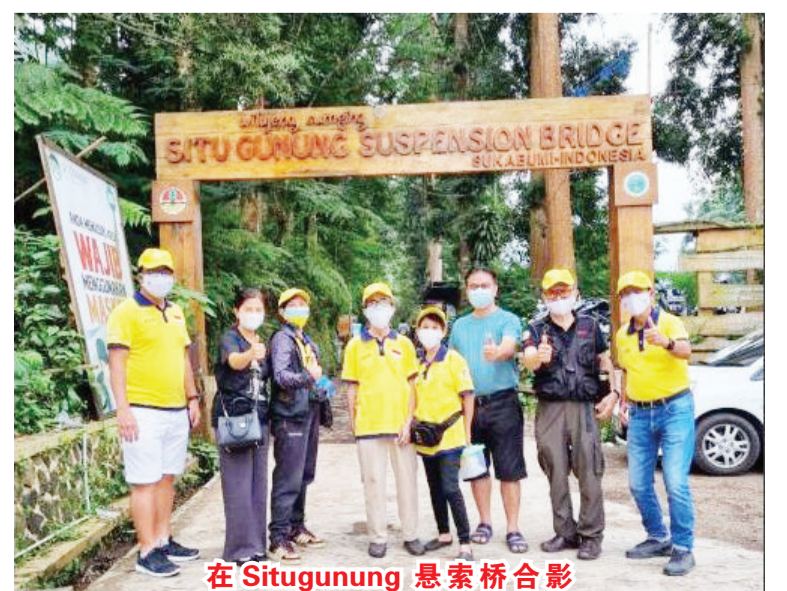
在 Situgunung 悬索桥合影