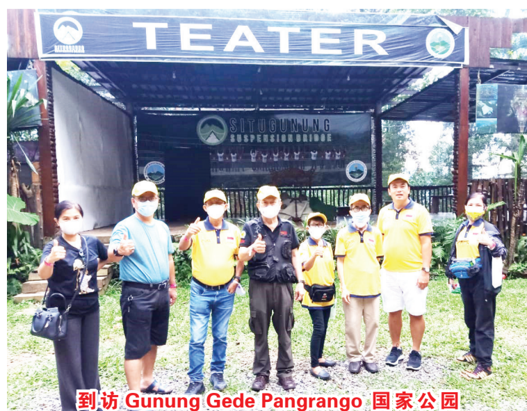
到访 Gunung Gede Pangrango 国家公园