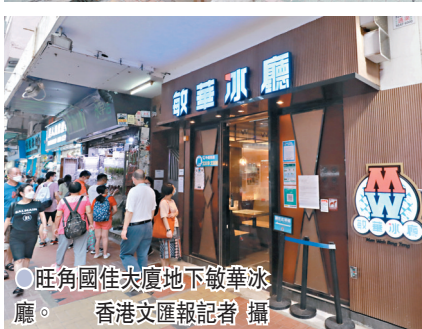
旺角國佳大廈地下敬華冰廳