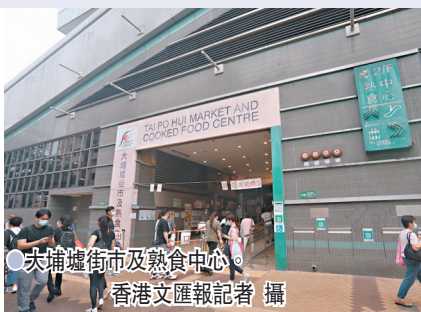
大埔墟街市及熟食中心