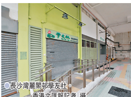
長沙灣麗閣鄰學友社