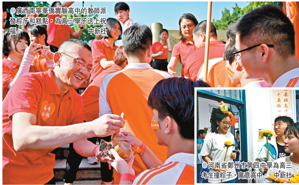
廣西南寧華僑實驗高中的教師派發粽子和糕點，為高三學子送上祝福。

另外，今年高考將以最嚴厲的手段，打擊考試作弊。教育部要求，要嚴密做好考試組織，嚴守試題試卷安全生命線，狠抓製卷、運送、保管、分發、回收等關鍵環節保密管理。此外，要嚴厲打擊考試舞弊，各地進一步加強管理，積極採取多種檢測手段，防止各種作弊工具進入考場。同時，採取多證核對、人機比對等措施嚴防替考。教育部還統一公布了高舉報電話。