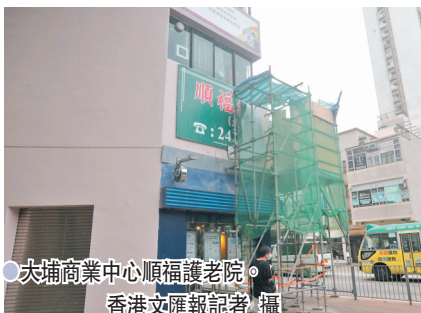
大埔商業中心順福護老院