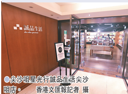
尖沙咀星光行誠品生活尖沙咀分店