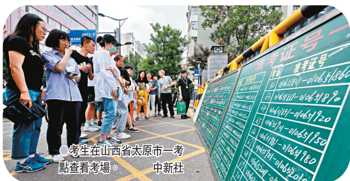
考生在山西省太原市一考點查看考場。