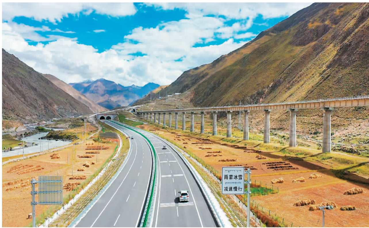
G6京藏高速羊八井至拉萨段。