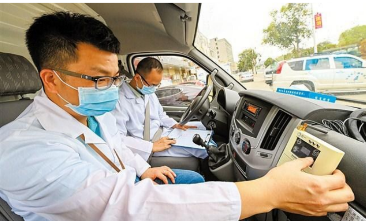
→工作人員調節好冷藏車溫度，準備將疫苗運至澄海區新溪衛生院接種點。