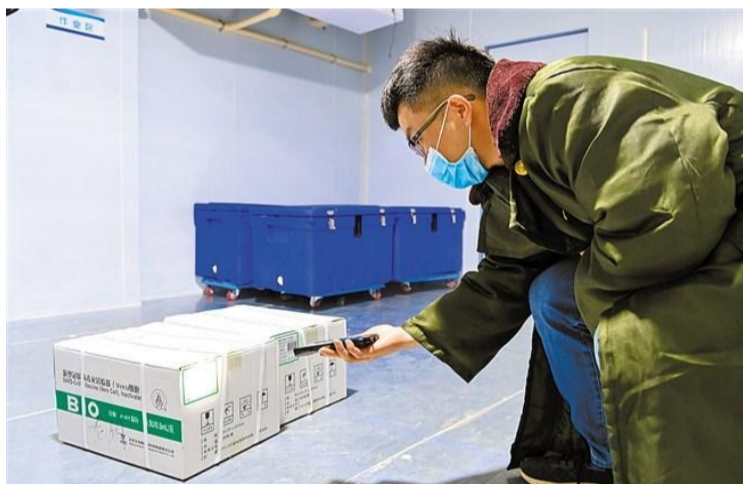
→工作人員掃描疫苗包裝條碼，對疫苗信息進行錄入。