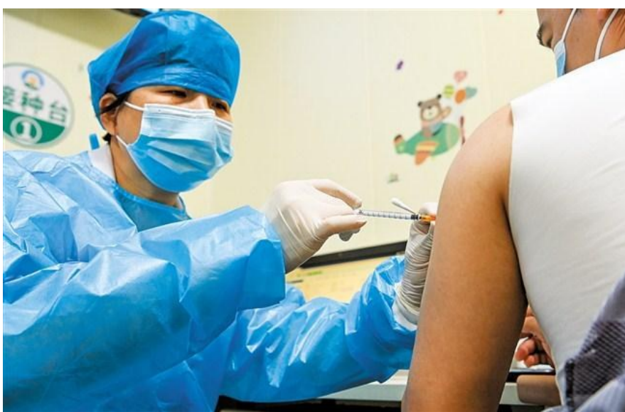
←醫生為汕頭市民接種新冠疫苗。