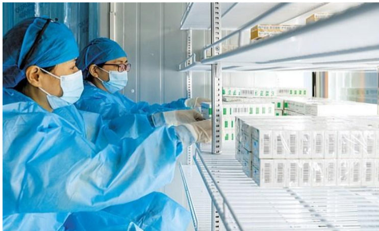
→工作人員將剛剛送抵的疫苗放進冷藏庫裏。