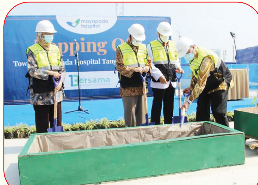
丹格朗国信医院经理马尔古斯医生在进行铲土仪式