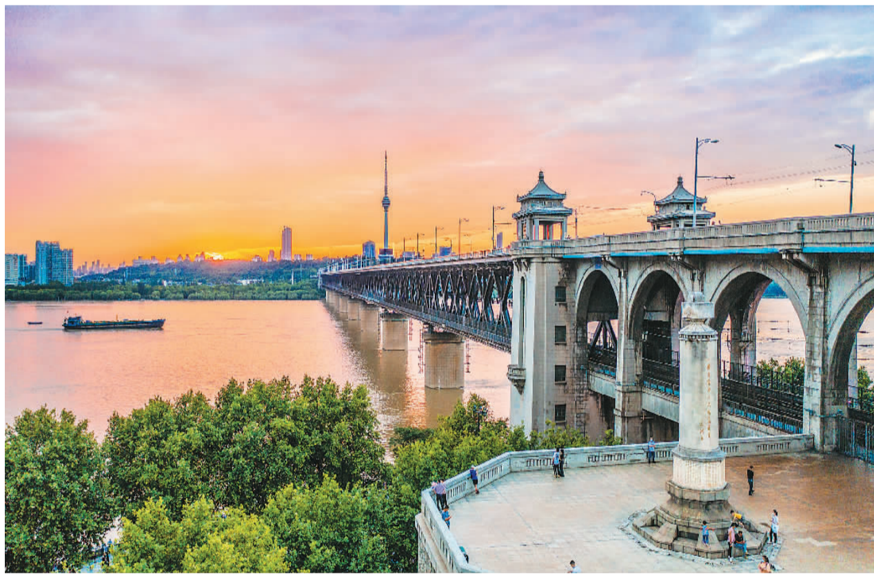
晚霞映衬下的武汉长江大桥。