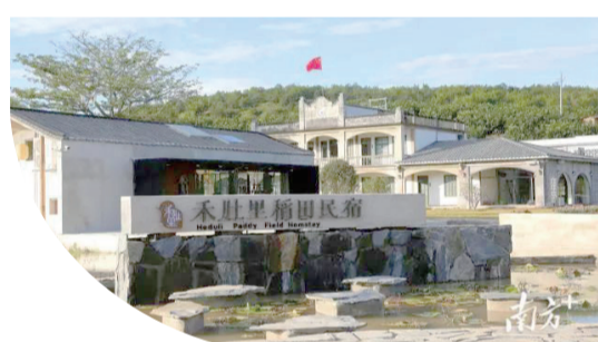
▲禾肚裏稻田民宿在西河鎮漳北村落地，讓自然生態村居變成山水田園景區，帶動當地產業經濟發展。