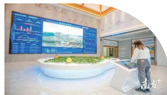
▲大埔縣建設打造涵蓋大埔蜜柚產業種植、加工、物流、市場、銷售等全產業鏈的“5G+農業大數據服務平臺”，實現大埔蜜柚的數字化轉型升級。

為強化振興責任，突出示範帶動，大埔縣還通過擂臺大賽，推行“10+5”競選機制來打造一批鄉村振興示範村，以財政獎補的“小資金”撬動社會的“大投入”，激活黨員幹部內生動力，掀起美麗鄉村建設熱潮。