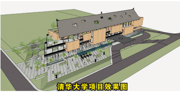
清华大学项目效果图

虽然在一般粘土土质下使用3米护筒就足够，但鉴于整个桩身贯穿21米深度的土质全部为砂层，经过综合考虑，项目部在桩基工程授标伊始便要求桩基公司加长护筒至12米，经过实践证明，12米的护筒有效的防止了塌孔，不仅节约了时间还避免了塌孔造成的混凝土浪费。