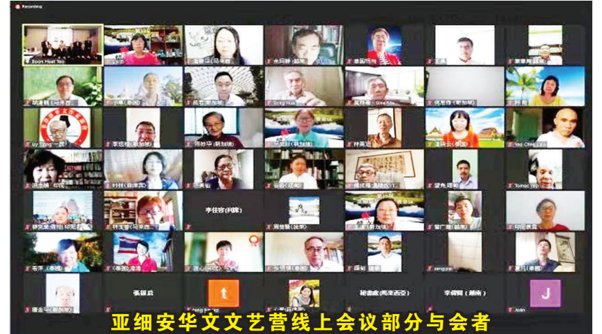
亚细安华文文艺营线上会议部分与会者