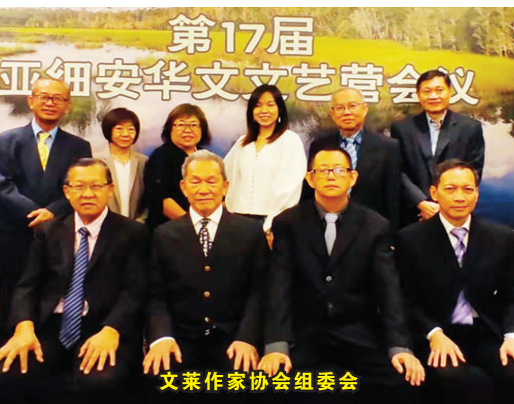
文莱作家协会组委会