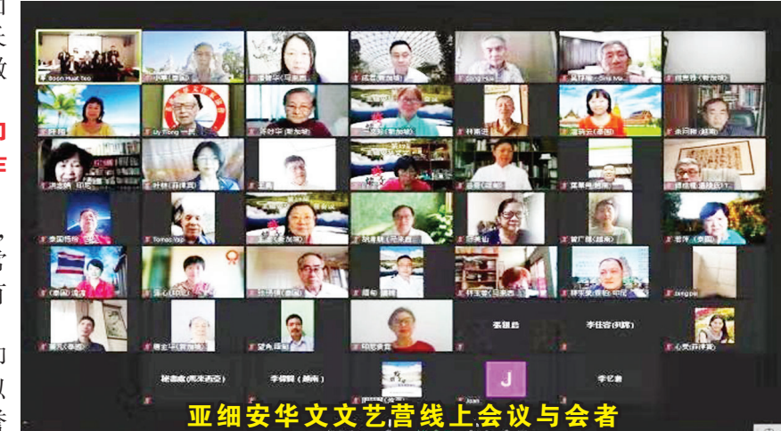
亚细安华文文艺营线上会议与会者

其他亚细安国家的得奖人或代表也相继作了发言。紧接着，在来自汶莱的王勇，新加坡的林子等宣读论文以及商讨由越南承办下届文艺营之事宜后大会宣告结束。(袁霓报道)