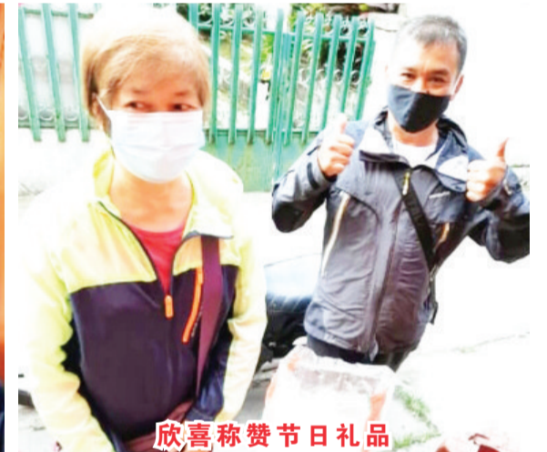
欣喜称赞节日礼品