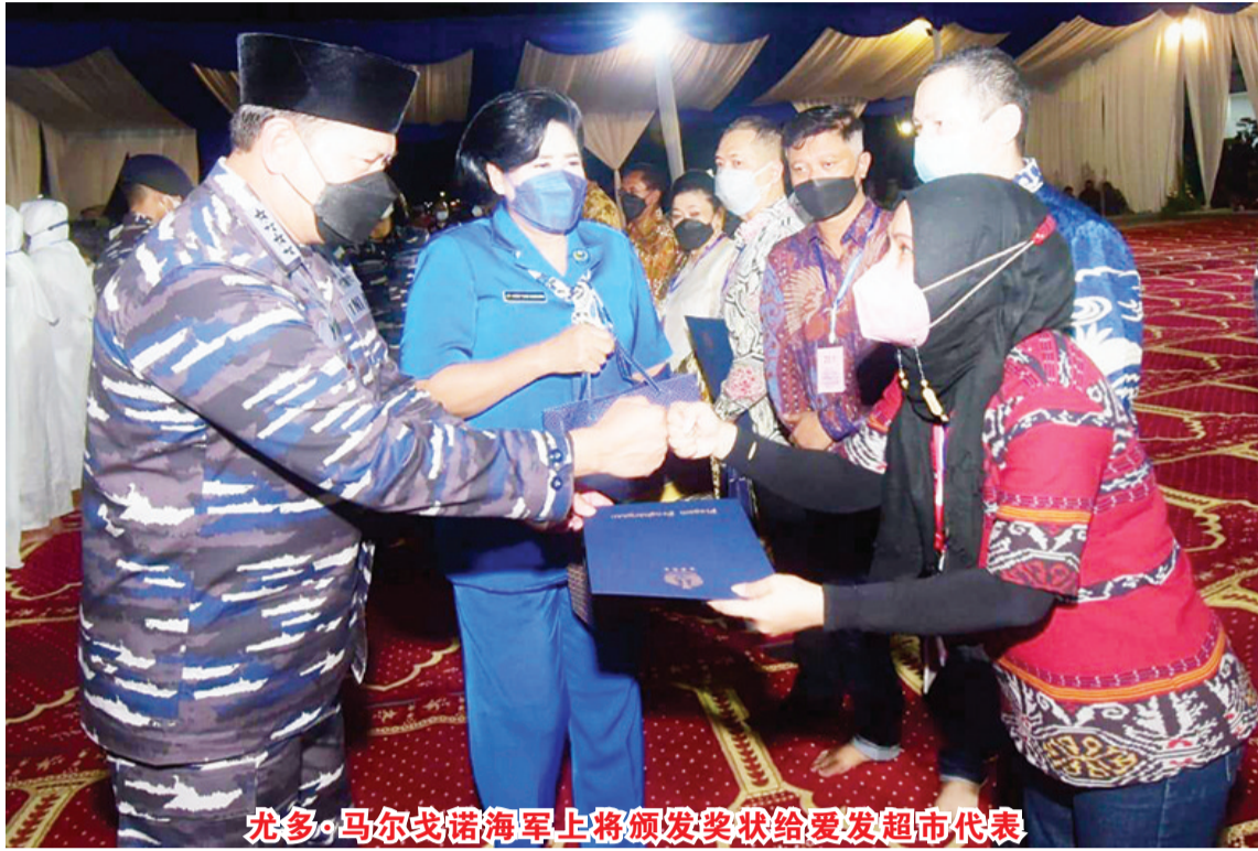
尤多·马尔戈诺海军上将颁发奖状给爱发超市代表