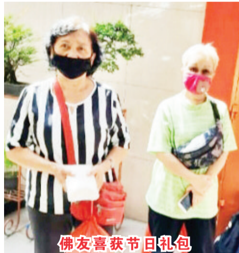
佛友喜获节日礼包