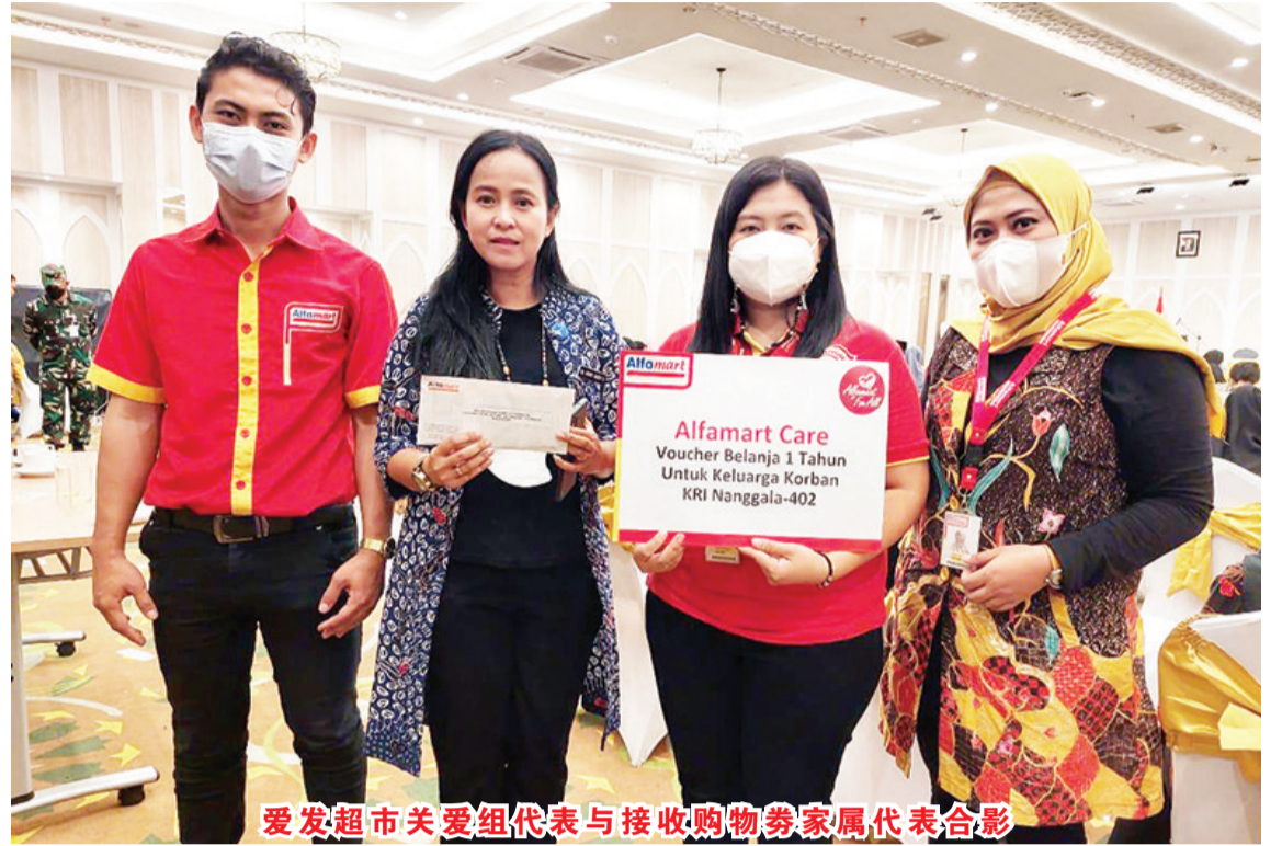
爱发超市关爱组代表与接收购物券家属代表合影

【本报讯】2021年6月3日，星期四，印尼海军部在爪哇泗水丹戎露雳军港 Koarmada II 总部举行联合祈祷，以纪念 KRI