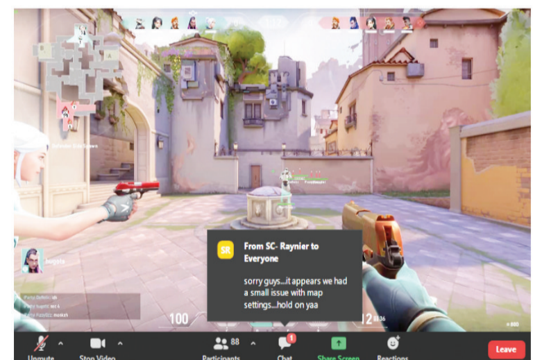
学生们化身特工，激烈角逐！