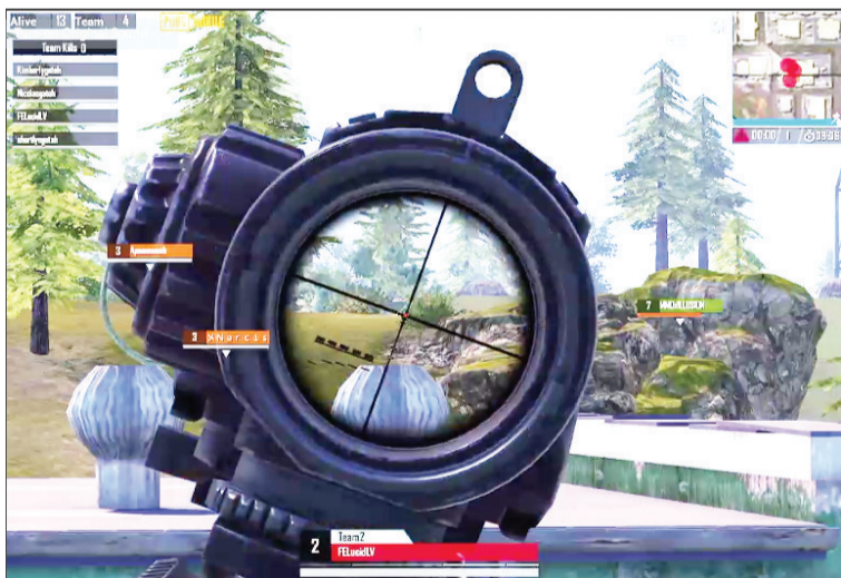
在比赛中，学生们精诚合作！