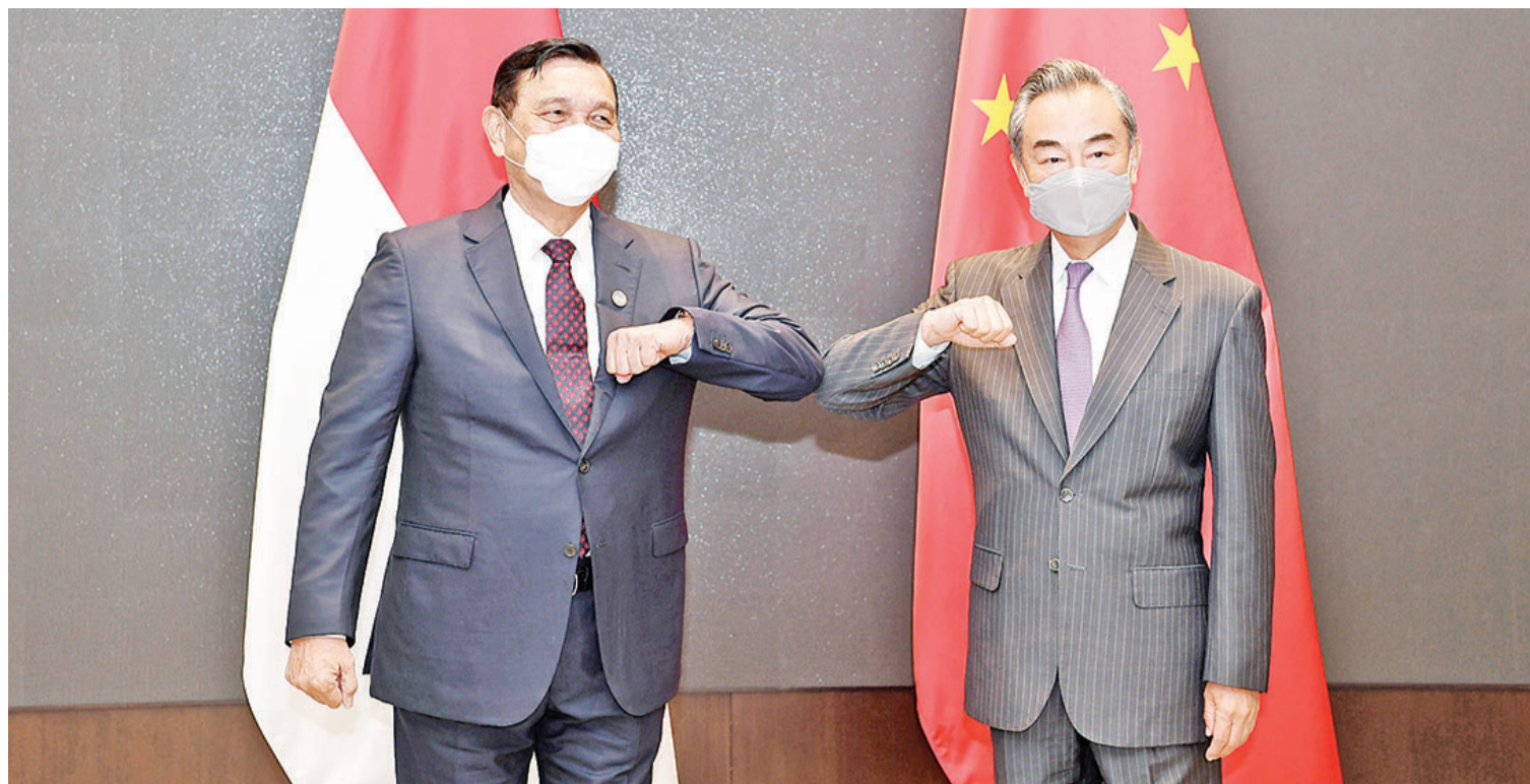
王毅卢胡特共同主持中国印尼高级别对话合作机制首次会议。

二是深化新冠疫苗和卫生健康合作。双方将继续深化疫苗研发、生产、分配等全产业链合作,助力印尼打造区域疫苗生产中心。双方支持豁免新冠疫苗知识产权,主张扩大疫苗可及性和可负担性,抵制“疫苗民族主义”,防止“免疫鸿沟”,携手推进疫苗在全球范围公平合理分