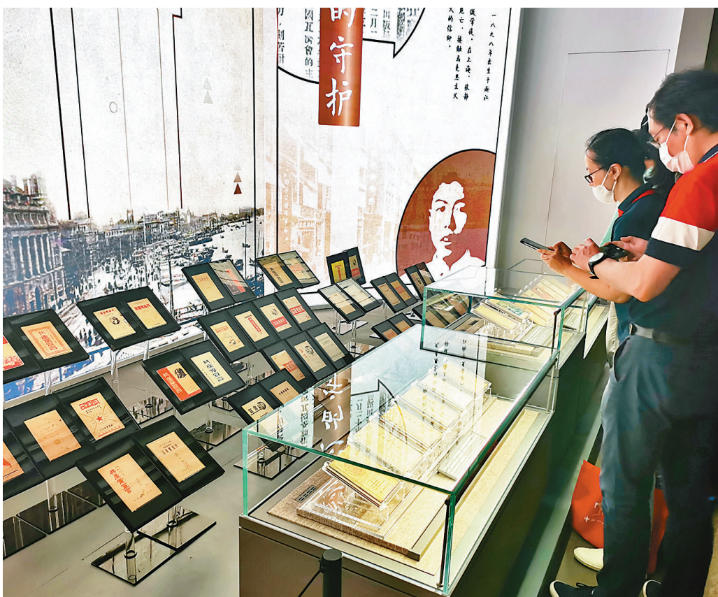
●紀念館將館藏的72版本《共產黨宣言》全部展示出來。

工作人員告訴香港文匯報記者，中共一大通過了黨的第一個綱領和第一個決議，決定設立中央局，選舉產生中央局成員，宣告中國共產黨正式成立。遺憾的是，這兩份重要文件原件並沒有保存下來，現在存世的有蘇聯的俄文版和陳公博在他論文中記錄的英文版，紀念館裏陳列的《黨綱》摘錄就是從俄文版翻譯而來。此外，館內還展示了俄羅斯國家社會政治歷史檔案館和美國哥倫比亞大學東亞圖書館裏找到的俄文本、英文本和翻譯過來的俄譯本、英譯本。其中的兩份文件的英文本皆出自陳公博1924年在美國哥倫比亞大學讀碩士時發表的一份名為《共產主義運動在中國》的論文，論文的附錄中收錄了六篇文獻，《綱領》和《決議》就是其中的兩篇。