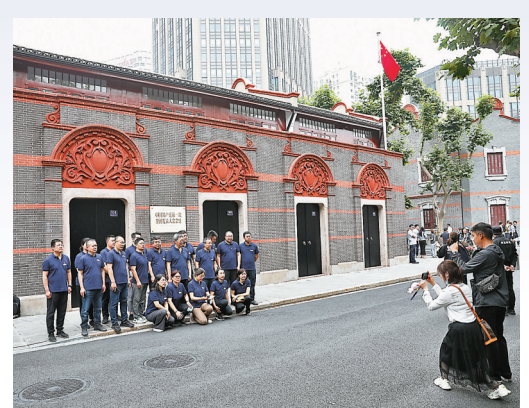
●3日，中國共產黨第一次全國代表大會紀念館正式開館。中新社

這間會議室，現在也成為萬千黨員的精神家園。2017年10月31日，中共十九大閉幕後不到一周，中共中央總書記習近平就帶領中共中央政治局常委瞻仰上海中共一大會址，重溫入黨誓詞。習近平曾動情地說：「我們黨的全部歷史都是從中共一大開端的，我們走得再遠都不能忘記來時的路。」。館方作過統計，自中共十九大至今，共接待觀眾近400萬人次。