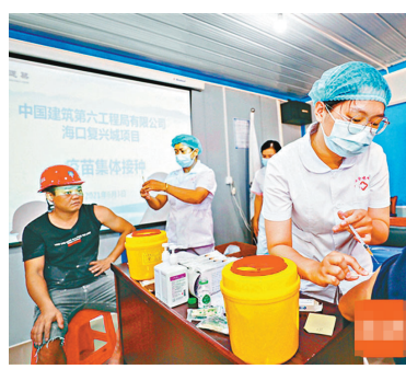
3日中午，海口市醫護人員走進工地為工人接種新冠疫苗。

網上圖片和新疆生產建設兵團累計報告接種新冠疫苗70,482.6萬劑次。同時，2日創下單日接種量新高，達2,291.8萬劑次。