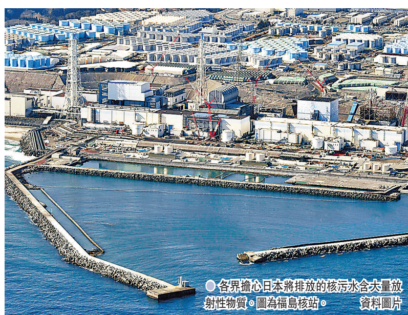
各界擔心日本將排放的核污水含大量放射性物質。圖為福島核電站。資料圖片

香港文匯報訊 日本早前宣布計劃於兩年後，將福島核電站核污水排入海洋，日本政府有關人士3日向多間港、澳傳媒舉行簡介會，重申有關核污水的放射物質已大幅稀釋，安全程度達國際標準，不過有關人士避談核污水的危害，亦沒有提及賠償周邊國家等問題。