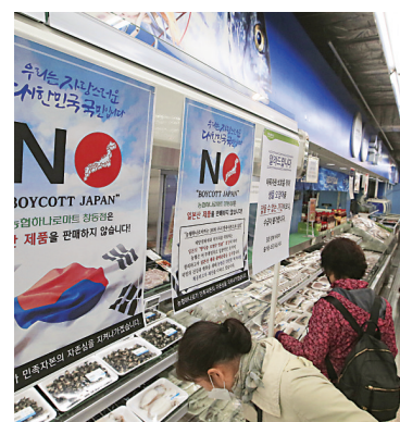
韓國首爾一間商店的海鮮區懸掛「不賣日本產品」的標誌。