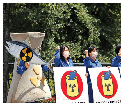
環保組織成員5月12日在首爾集會，要求日本撤銷排放核廢水的決定。