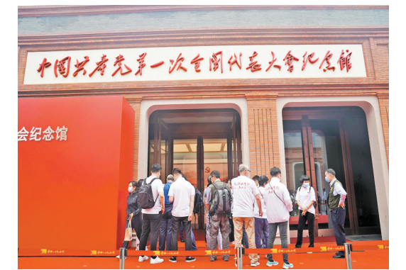
中共一大紀念館開館。新華社

【香港商報訊】據新華社消息，位於上海市的中國共產黨第一次全國代表大會紀念館昨日開館，設有基本陳列「偉大的開端——中國共產黨創建歷史陳列」，黨創建時期的紅色文物得到「集結」展示。 紀念館由中共一大會址、宣誓大廳、新建展館等部分組成，新的基本陳列展廳面積超3000平方米，在館藏12萬件(套)文物和近年來從國際國內新徵集檔案史料中，紀念館精選出612件文物展品，較原先基本陳列展出的文物數量大幅擴容。 展覽共7個板塊，分別為「歷史選擇 偉大起點」「前仆後繼 救亡圖存」「民衆覺醒 主義抉擇」「早期組織 星火初燃」「開天闢地 日出東方」「砥礪前行 光輝歷程」「不忘初心 牢记使命 永遠奮鬥」，生動體現中國共產黨的誕生和百年奮鬥歷程。