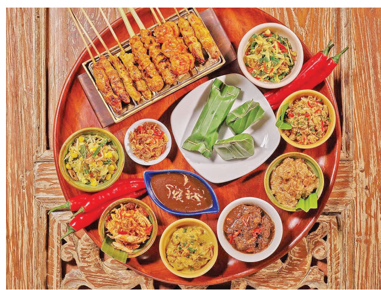
亨氏先生推荐的巴厘美食

年轻时期的亨氏先生偶尔在瑞士洛桑著名的咖啡店De La Paix实习时产生对烹饪的兴趣,后来八十年代在新加坡担任希尔顿和凯悦酒店总厨时,又迷恋上了美食摄影艺术。1990年,被调往巴厘岛担任君悦酒店行政总厨,随后在丽思卡尔顿酒店工作更是对巴厘及印尼美食产生了浓厚的兴趣。多年来,对美食和记录食谱的渴望促成撰写8本关于印尼和巴厘食谱的书籍,其中包括《Bali Unveiled(巴厘揭秘)》、《A New Approach to Indonesian Cooking(新手印尼烹饪突破)》、《Feast of Flavours from the Indonesian Kitchen(印尼厨房大宴美味)》、《The Little Indonesian Cookbook(印尼小食谱)》等