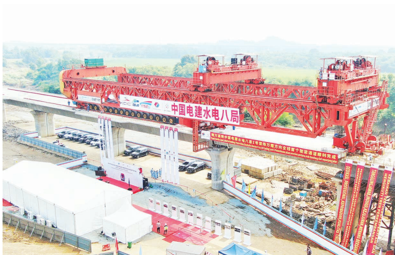
5月28日,雅万高铁完成首段架梁通道架设

目前,雅万高铁建设已经进入路基、桥梁、隧道下部结构向架梁、铺轨转换,工程建设向运维准备转换的关键阶段。全线土建工程已完成总量的83%,全线13座隧道已贯通7座,大部分重点路