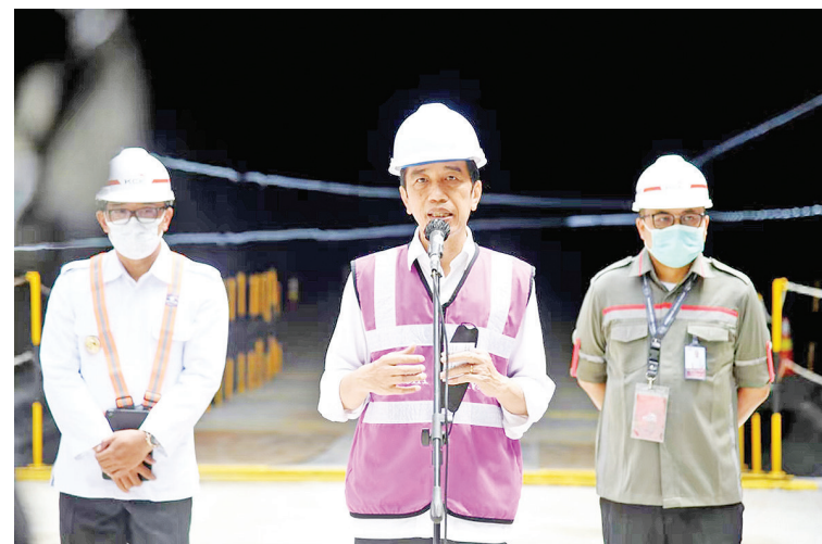
5月18日,佐科总统(中)到雅万高铁建设工地视察

雅万高铁是“一带一路”倡议与印尼“全球海洋支点”战略对接的重大项目。自2018年6月全面开工建设以来,在中印尼两国元首的高度重视和亲自推动下,中国国铁集团牵头组织中方参建企业与印尼政府、企业密切