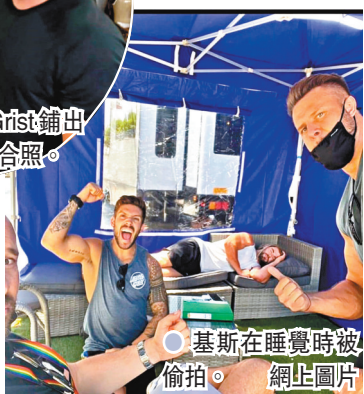
基斯在睡覺時被偷拍。