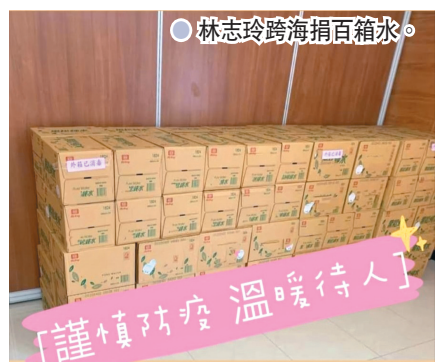
林志玲跨海捐百箱水。