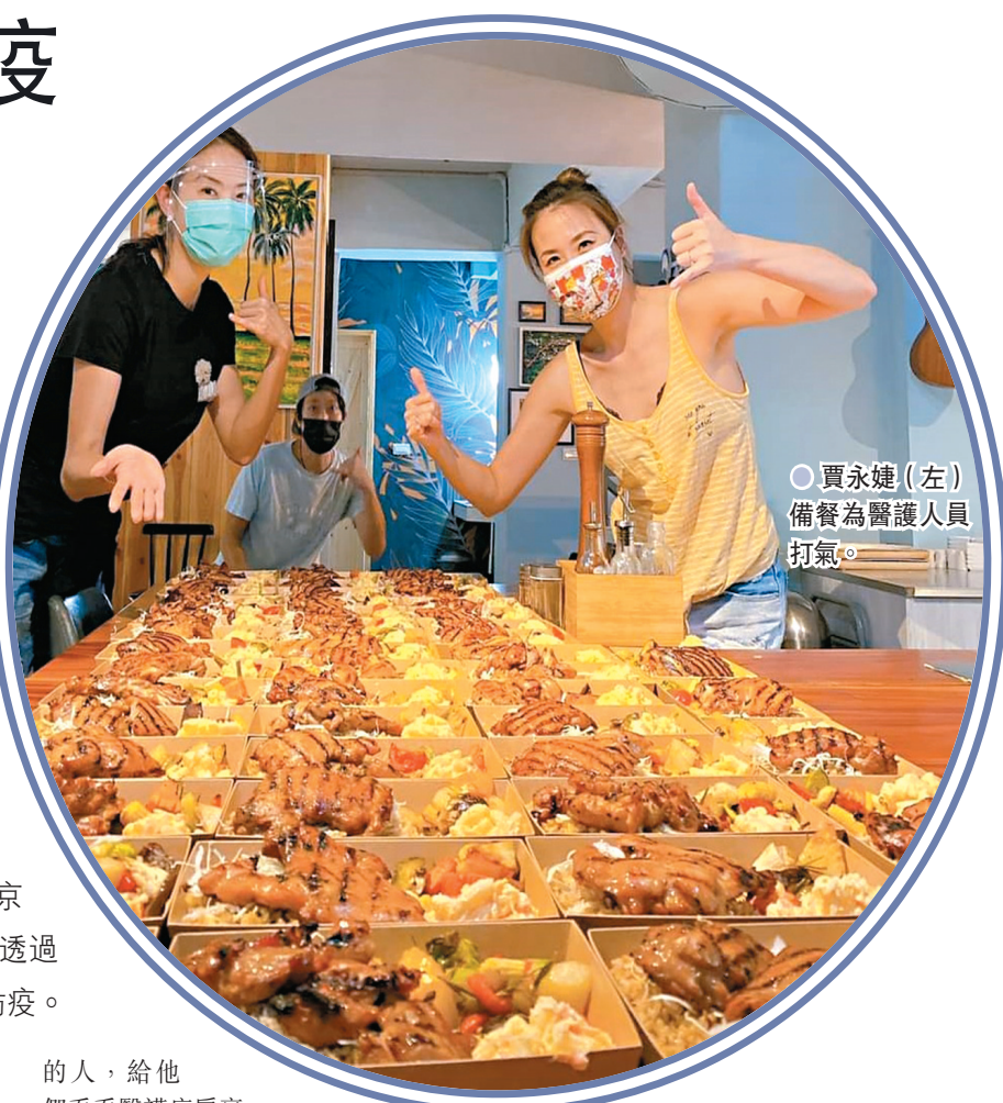
賈永婕(左)備餐為醫護人員打氣。

香港文匯報訊(記者 文芬)近期台灣新冠疫情升溫，醫療系統飽受壓力，不少藝人都十分關心台灣的狀況。有「三鐵辣媽」之稱的女星賈永婕近日宣布決定每天送100個愛心便當為醫護加油打氣，並親自送便當到醫院，其好友小S(徐熙娣)得知後也二話不說加入響應，並說：「英雄們加油！」林志玲和老公AKIRA在東京抗疫，仍關注台灣疫情狀況，得知萬華、中正等重災區缺飲用水，林志玲立刻透過慈善基金會捐贈100箱水救急，馬來西亞華人女歌手梁靜茹也呼籲大家自律防疫。