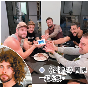
《雷神4》團隊一起吃飯。

Aaron除了PO出與基斯戴上假髮的照片，還有《雷神》團隊的一群演員聚在一起吃飯、看球賽、海邊遊玩，甚至睡覺時候的偷拍照，從照片上就可看到，團隊相處十分友好。