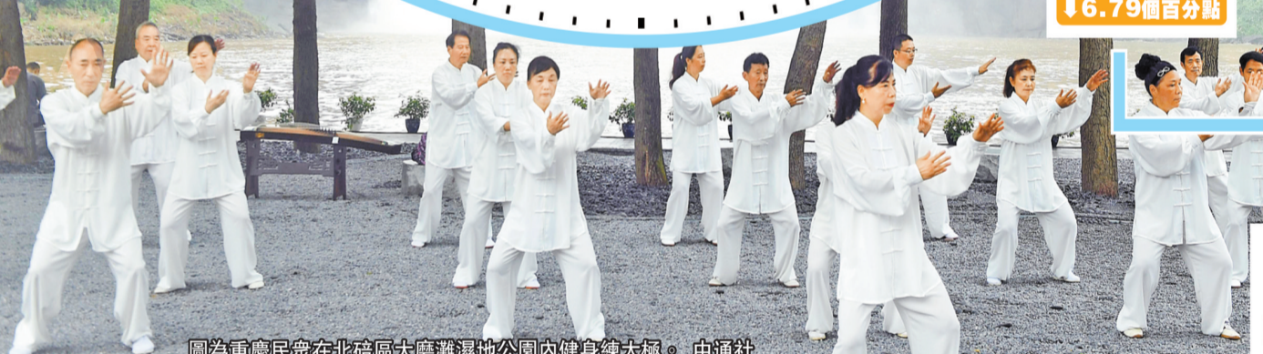
圖為重慶民衆在北碚區大廬灘濕地公園內健身練太極。 中通訊