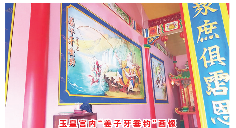
玉皇宫内“姜子牙垂钓”画像