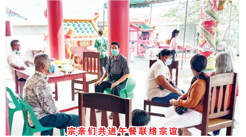
宗亲们共进午餐联络宗谊