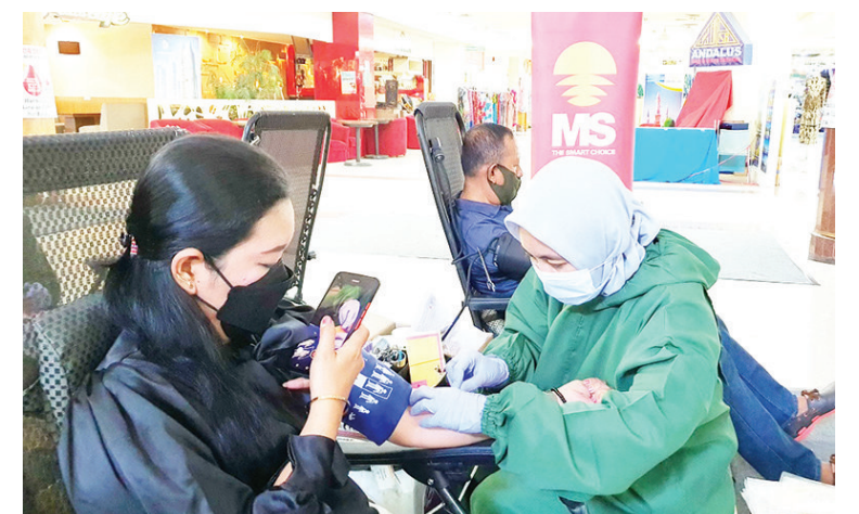
献血者在接受采血