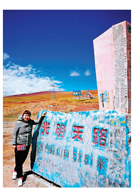
●到達海拔5,231米的唐古拉山口。

從那曲市到長江源，距離有412公里，明天，我們將走完這412公里到達長江源。在這裏，我可以代親愛的爸爸媽媽親親長江源頭，親親長江源頭第一橋，親親長江流域第一哨站，向解放軍叔叔問個好！