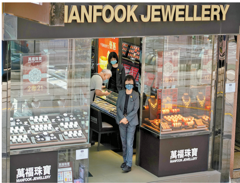
▲本港今年4月零售業總銷貨額同比上升12.1%。圖為一間珠寶店營業中。

法國外貿銀行亞太區經濟學家吳卓殷則認為，香港零售復蘇步伐有減弱跡象，但相信5月有望再度加快，料按年升幅介乎15%至20%，料全年增長12%；雖然港府下半年派發電子消費券，有助減輕市民負擔，但未必可提振香港整體消費市場。