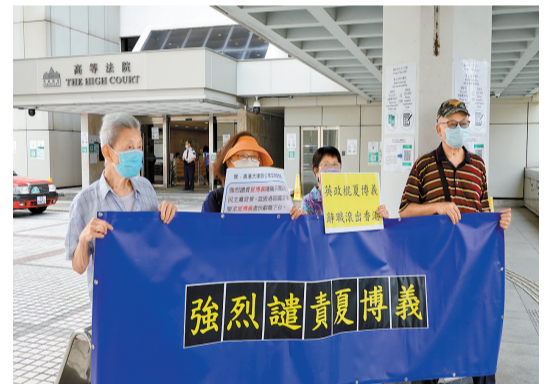
市民到高等法院請願，強烈譴責夏博義反華亂港。