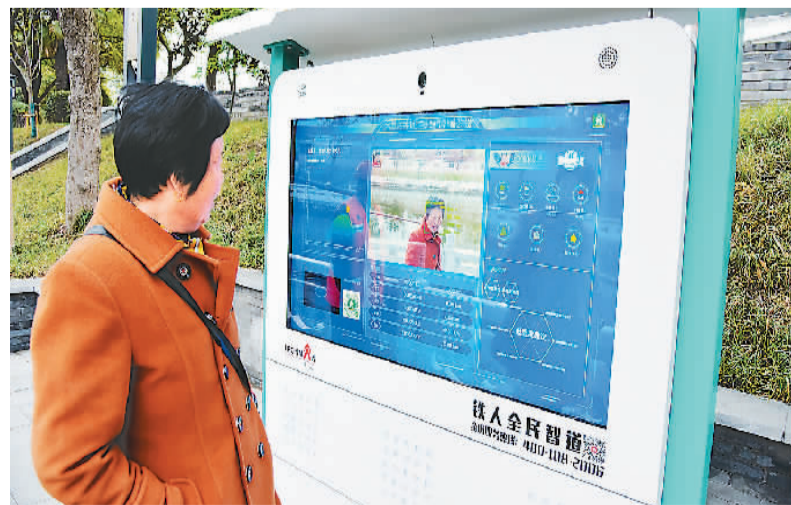
在江苏省如皋市外城河,市民正在体验健身步道智能体测一体机系统。

业内人士指出,国家的政策引导为更好满足人们的健身需求指明了智能化发展方向。智能化探索不停步,相信未来会有更“聪明”、更“时尚”的设施、场所出现在人们的生活中,让锻炼更科学、更有趣。