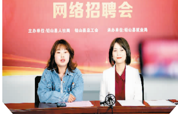
▲浙江广厦建设职业技术学院(本科)首场5G云直播招聘会在校园内开展。 ▲在江西省上饶市铅山县就业局,企业工作人员正直播招聘。

聘变得更高效率。据悉,此次专项行动期间,人社部将组织浙江、湖北、重庆等地方公共就业人才服务直播平台,开展行业性、综合性“直播带岗”活动和就业创业政策宣传解读活动,重点涵盖智能制造、物流仓储、IT