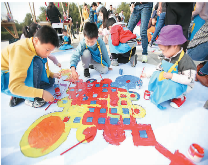
在家长的陪伴下，孩子们在南京科技馆绘制非遗画卷。

新玩法在博物馆游中也越来越普及。在一些博物馆，游客可以听到资深讲解达人、知识类大赛获奖选手、或是资深导游等的讲解，还可参与博物馆线上之旅。携程发布的2021年上半年文博游大数据显示，上半年亲子家庭预订博物馆的票量相比2019年同期增长21%，