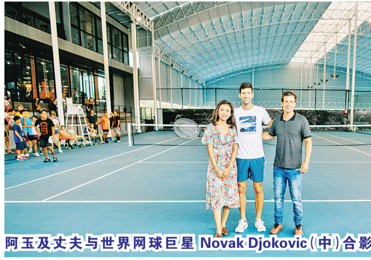
阿玉及丈夫与世界网球巨星 Novak Djokovic(中)合影

答:我们最大的目标是吸引全世界的网球职业选手在巴厘岛进行比赛,让巴厘岛成为未来世界舞台上的公开赛场馆之一。巴厘自然绝美的景色足可将赛事和度假连为一体来促进巴厘岛的旅游业。同时,我们希望更多有更多的青少年能够参与到网球学习中。今年九月,我们将会在沙努(Sanur)落成含 7 个场地的网球中心,并附