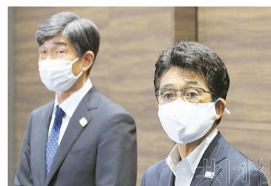
东京奥运日本代表团启动疫苗接种 首日 200 人接种

6 月 2 日,据《共同社》,参加东京奥运会的日本代表团 1 日在东京都北区的味之素国家训练中心正式启动新冠疫苗接种。据日本奥委会(JOC)