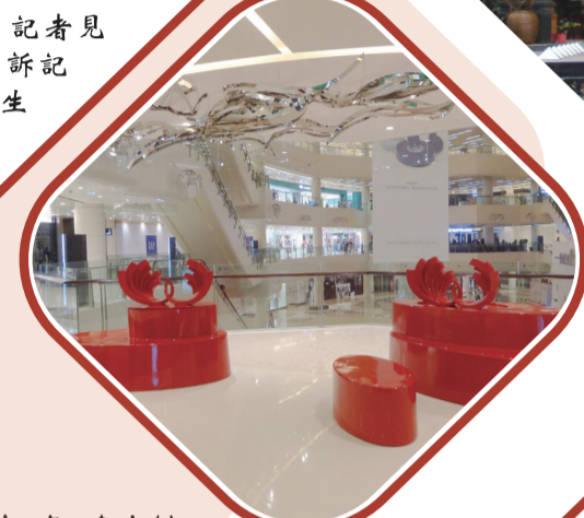
▲天津銀行廣場銀河