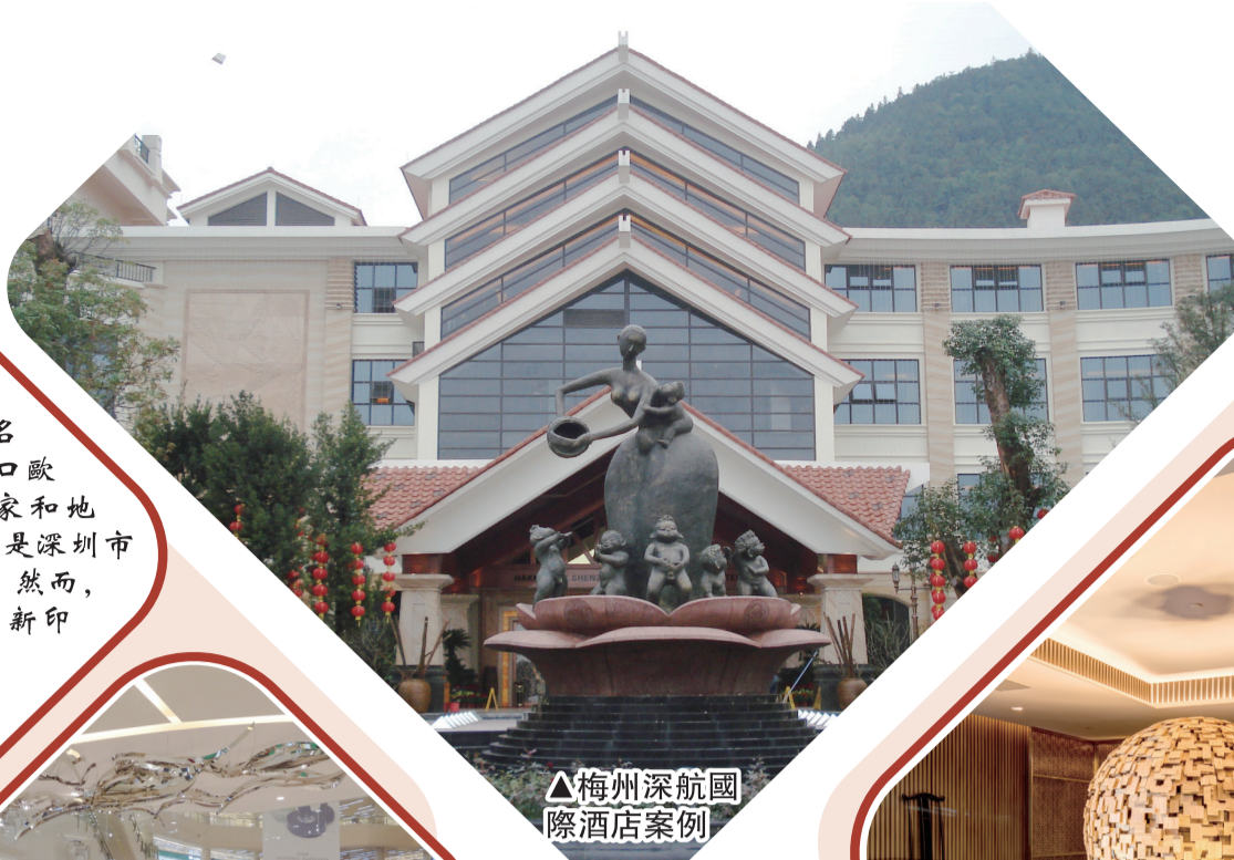
▲梅州深航國際酒店案例