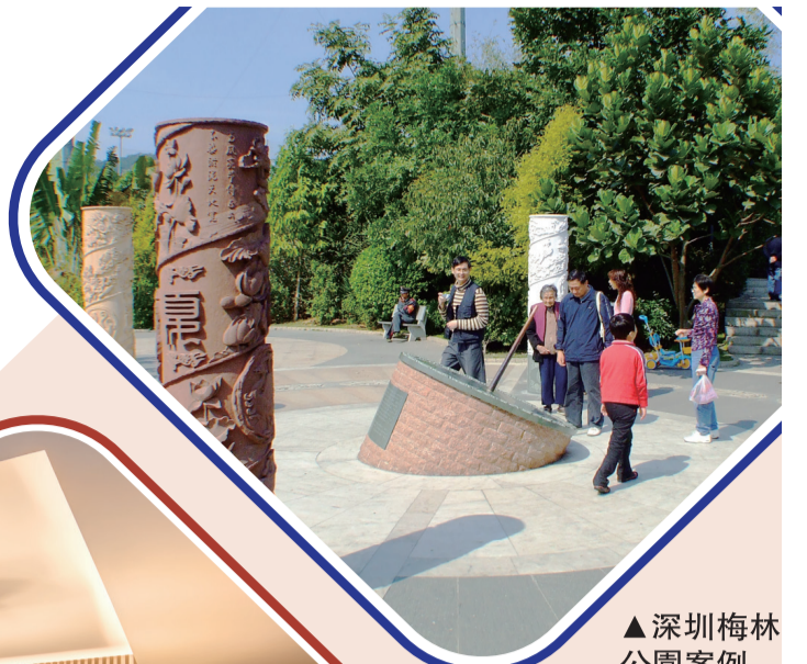
▲深圳梅林公園案例