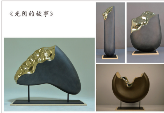
▲新印象作品——光陰的故事