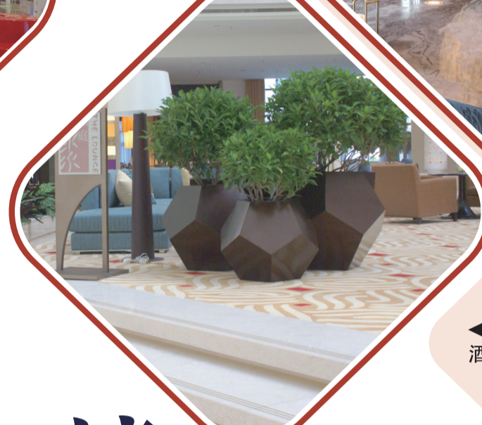
▲天津萬麗酒店案例