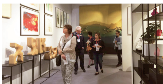
▲新印象的展品打動了外國友人

如此專業、如此用心，產品自然很出色。新印象的出色，贏得了眾多知名的客戶，長江實業、新鴻基地產、恒基兆業地產、遠雄建設、鄉林建設、萬科地產、華潤置地、綠地集團、名巨地產，以及深圳機場凱悅酒店、天津萬麗賓館、南京涵碧樓、深圳平安柏悅酒店、廣州K11、華潤萬象城、天津銀河廣場、上海虹橋新天地、深圳梅林公園、梅州客天下等紛紛與新印象合作。同時，新印象的出色也叩響了外國人士的心扉，產品源源不斷地出口到歐美、中東、東南亞等十幾個國家和地區。高峰時期，年出口量達1萬件以上。