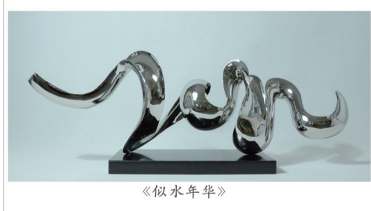
▲新印象作品——《似水年華》