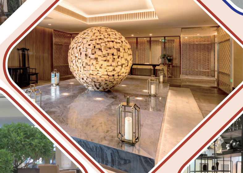
▲深圳機場凱悅酒店案例