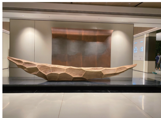
▲溫州樓盤售樓處案例