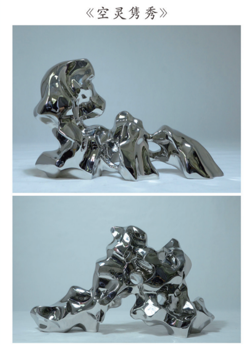
▲新印象作品——《空靈雋秀》