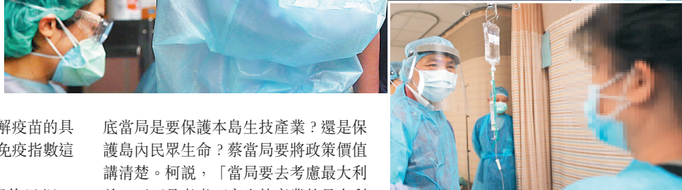
●新北市雙和醫院5月31日發生隔離治療的確診病患持刀攻擊3名護理師案，市長侯友宜（左）前往探視及慰問受傷護理人員。