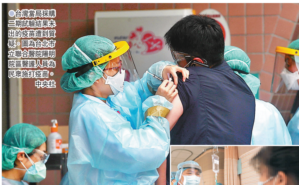
●台灣當局採購三期試驗結果未出的疫苗遭到質疑。圖為台北市立聯合醫院陽明院區醫護人員為民眾施打疫苗。

對於當局對大陸生產的疫苗，或是上海復星集團代理的BNT疫苗（復必泰）表態不信任，陳宜民認為，無論是BNT疫苗或是大陸國藥集團生產的疫苗，都獲得了WHO的認證授權，在安全、保護力上都有保障，當局不應因意識形態等理由而質疑和拒絕。 台北市長柯文哲再嗆蔡當局，現在到底當局是要保護島生技產業？還是保護島內民眾生命？蔡當局要將政策價值講清楚。柯說：「當局要去考慮最大利益，而不是考慮兩家生技產業的最大利益。」 柯文哲說，一年之前，若全世界都沒有疫苗，台灣感染嚴重，台灣要簽約島內產疫苗，這樣做他不會講什麼，這是依據當時的環境決策，但現在的狀況是，目前全世界有18億劑疫苗被打過，加上WHO國際認證疫苗也有六種，每種也都被打上億劑，很清楚在這個原則下，要去採購一個二期都還沒有做完的疫苗？ 柯提到，境外三期做完的疫苗也都有明確價格，但當局卻要簽約這個二期沒做完（的疫苗），明顯境外疫苗馬上可以買，但這時候卻要等島內產疫苗，當局應該要講清楚理由。