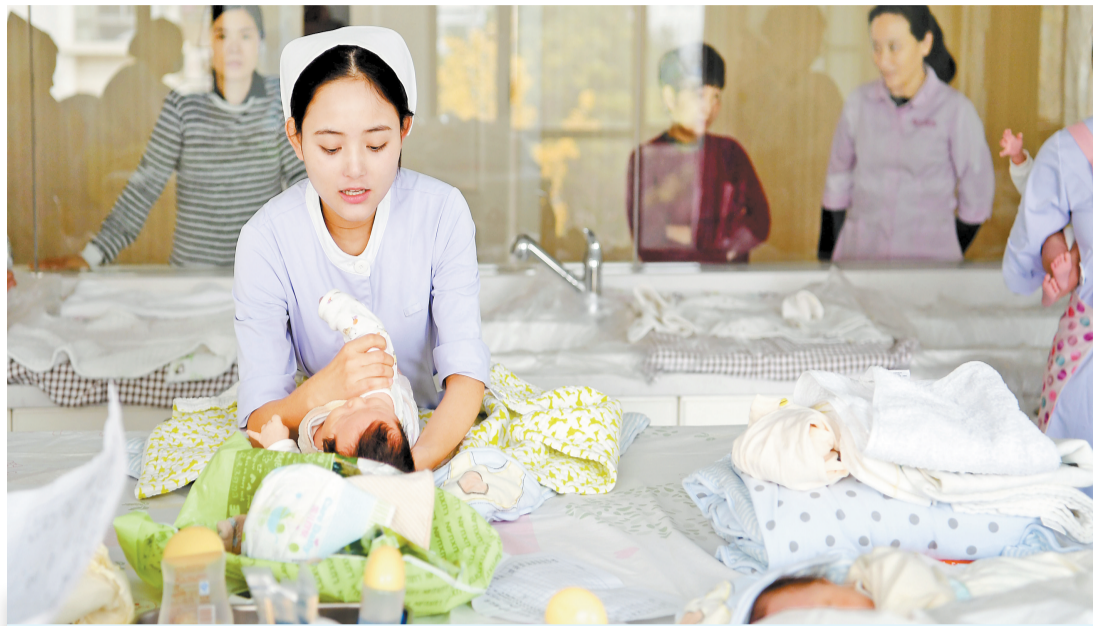
月子中心工作人員在給嬰兒洗澡護理。

【香港商報訊】記者童越報道：中共中央政治局昨日召開會議，審議《關於優化生育政策促進人口長期均衡發展的決定》，會議指出，進一步優化生育政策，實施一對夫妻可以生育三胎子女政策及配套支持措施，有利於改善中國人口結構、落實積極應對人口老齡化國家戰略、保持中國人力資源稟賦優勢。 受此消息推動，當日A股中一眾三孩概念股表現搶眼；港股三胎概念股漲勢更強勁，好孩子國際(01086)收漲超30%，愛帝宮(00286)收漲超21%，錦欣生殖(01951)一度漲超22%。專家表示，伴隨其後相關配套措施推出，三孩政策有助於減緩人口負增長進程，給中國經濟帶來新活力。