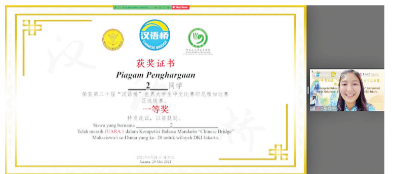
大学生组一等奖获奖选手