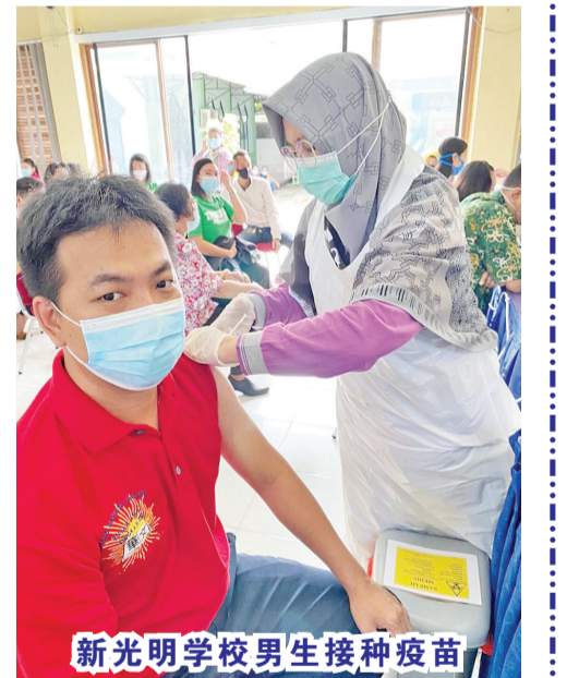
新光明学校男生接种疫苗