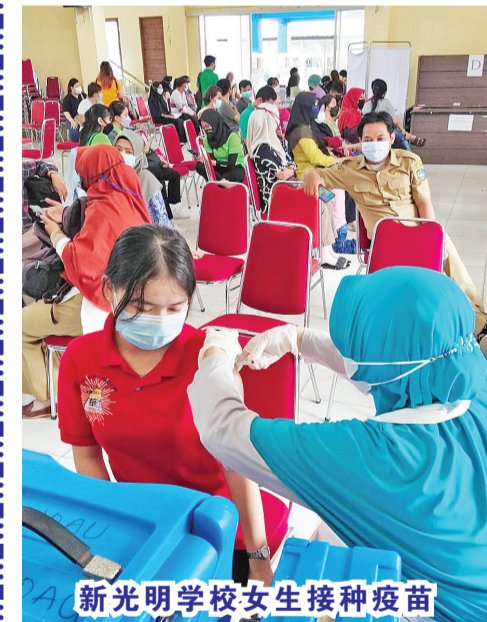
新光明学校女生接种疫苗