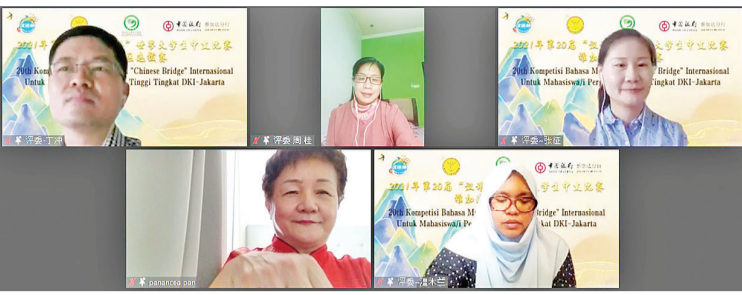
大学生组评委老师