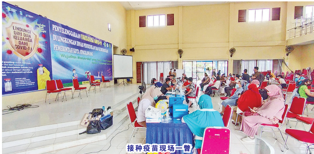
接种疫苗现场一瞥