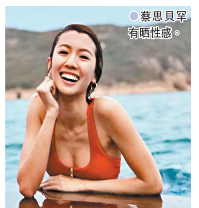
●蔡思貝罕有晒性感。