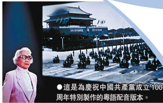
●這是為慶祝中國共產黨成立100周年特別製作的粵語配音版本。