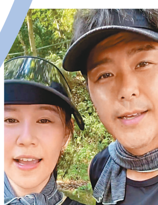
●翠如感謝老公這個陪跑男的支持。

了我的伴讀之友。我總是覺得我性格的缺陷,或多或少和我害怕(討厭)運動有關,我很易懦弱、怕事、不堅持、自卑,這些都不是做運動員應有的性格,更不是做演藝行業應有的特質。終於,我開始了,每天的0700晨早跑步,練體能,更要練意志。開始不難,堅持不易,願想透過跑步而令自己進步的你們和我們,一起加油。」而翠如已經連續跑了十天,每天06起床、07跑步、08吃早飯,她感謝老公這個陪跑男伴在她身邊的支持。