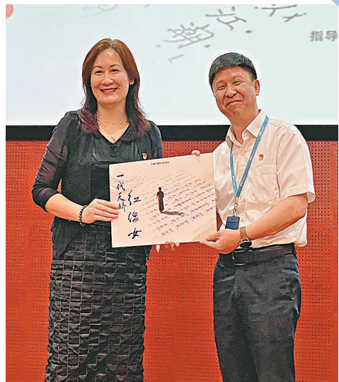
●10集人文藝術紀錄片《一代天嬌——紅線女》由出品方紅線女藝術中心贈予廣州圖書館收入館藏。