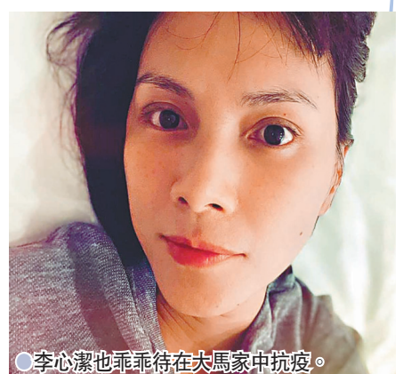
●李心潔也乖乖待在大馬家中抗疫。