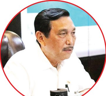
海事与投资统筹部长卢虎