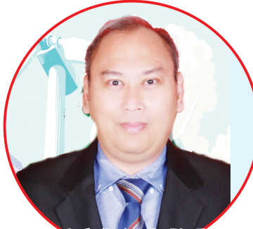
能源矿产资源部长安迪亚

【本报讯】5月25日，由印尼战略与国际研究中心(CSIS)、Tenggara Strategies和印尼驻东京大使馆主办的“中国在印尼可再生能源再投资”国际论坛成功在线举行，并得到印尼国家能源部、《雅加达邮报》和普拉塞迪亚·穆利亚大学(Prasetya Mulya)支持。印尼驻中国及蒙古大使周浩黎致欢迎词。