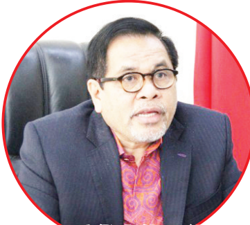
印尼驻华大使周浩黎