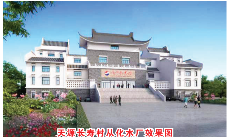
天源长寿村从化水厂效果图