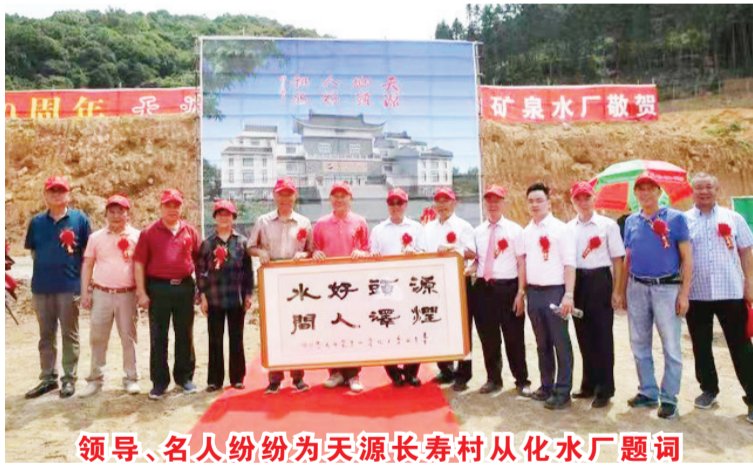
领导、名人纷纷为天源长寿村从化水厂题词

据悉,天源长寿村从化吕田水厂计划于2023年建成投产,届时将为普罗大众奉上更为优质的好水。(馥汐)