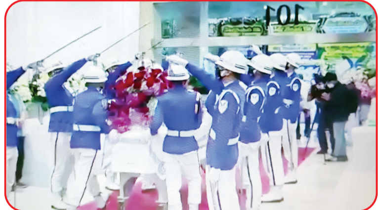
礼仪队护送灵柩到火葬场