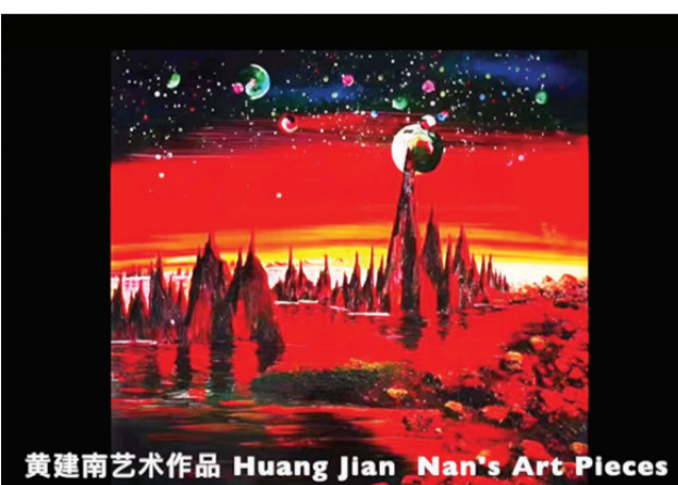
黄建南艺术作品 Huang Jian Nan's Art Pieces