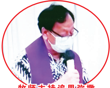
牧师主持追思弥撒