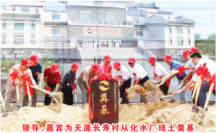
领导、嘉宾为天源长寿村从化水厂培土奠基