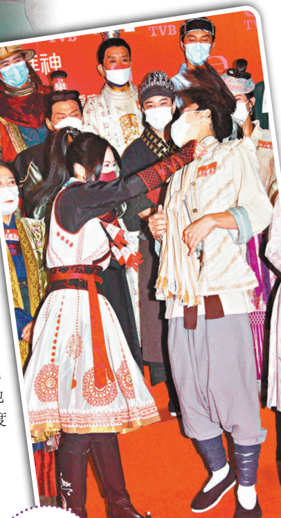
周嘉洛多是捱打的一位。