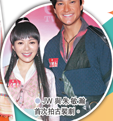
JW與朱敏瀚首次拍古裝劇。