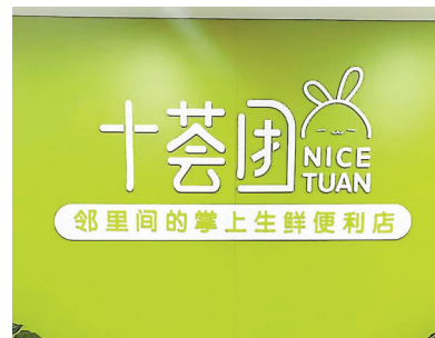
●十荟團因在部分地區的業務仍存在不正當價格行為，再被市監總局罰款150萬元，該平台江蘇區域須停業整頓三日。資料圖片

另外，中國銀保監會近期下發通知稱，將持續加強監管政策及成效信息的主動公開工作，主動公開權責清單等信息；通知並首次提及「加強反壟斷與反不正當競爭執法信息公開工作」。