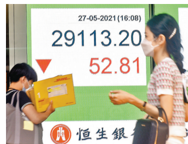
●港股27日一度跌逾210點，收市跌幅收窄。

京東分拆出來的京東物流，招股受市場熱捧，惟京東股價仍跌1.1%。小米首季業績優於預期，股價大升3.2%，是表現最好藍籌。高盛表示，小米首季純利增長較該行的預期快，故調升小米的目標價至33元。此外，大和、花旗及摩通等投行，同樣將小米的目標價上調，花旗及摩通給予的目標價同為35元，主要看好小米智能手機全年付運量可達2億台。