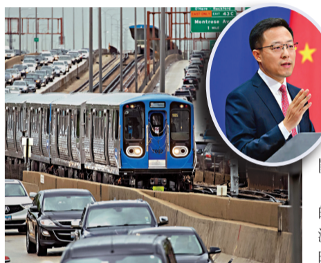
5月6日, 中國中車在美國製造組裝的地鐵在芝加哥載客試運行。