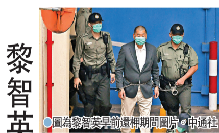
黎智英等10人違法集結判囚14至18個月

香港文匯報訊 香港壹傳媒集團創辦人黎智英、特區立法會前議員李卓人、何俊仁及梁國雄等10名攬炒派人士, 於前年國慶日在「民陣」申請遊行遭反對後, 煽惑市民由銅鑼灣遊行至中環被控。10人分別承認煽惑他人參與及組織未經批准集結等罪, 法官胡雅文28日於區域法院判罪。