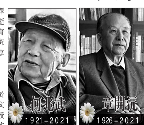
讀者中影響很大, 他在書中談到, 「讀書不一定非要有個目的, 而且最好是沒有任何目的, 讀書本身就是目的。」文史學者劉超曾評價稱, 「這部『濃縮了20世紀中國知識分子心靈史』的隨筆, 一經推出即受到多方矚目, 除了讓人了解民國教育及一代學人的成長歷程外, 也讓人們反思當下教育的種種困境。」

何兆武1921年9月生於北京, 1943年畢業於西南聯大歷史系。1986年至今任清華大學思想文化研究所教授, 兼任美國哥倫比亞大學訪問教授和德國馬堡大學客座教授。何兆武歷史研究著作有《中國思想發展史》等, 譯著代表作有羅素的《西方哲學史》、盧梭的《社會契約論》等。2006年, 何兆武推出口述史《上學記》, 該書