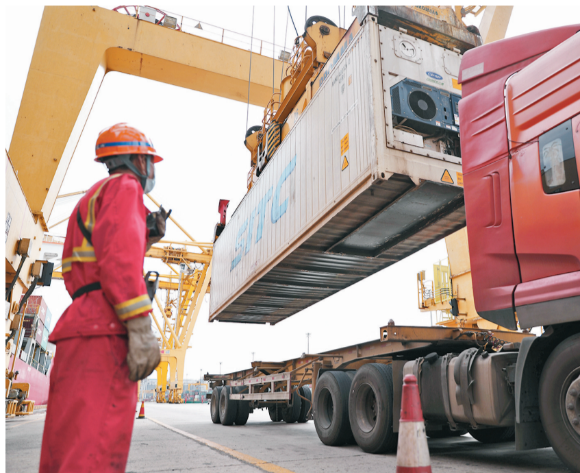
中國商務部公布的數據顯示, 2021年一季度中美貿易高速增长, 特別是在能源、農產品、汽車及零件等方面。圖為早前一輛貨車在大連港大連集裝箱碼頭有限公司港口裝載貨櫃。資料圖片