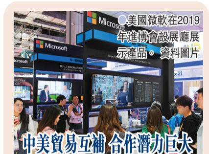
美國微軟在2019年進博會設展廳展示產品。資料圖片

就在27日下午舉行的中國商務部發布會上, 有記者問, 美國農產品數據顯示, 5月7日以來中國正加快自美玉米採購, 這是否意味著中方仍在而且將繼續積極履行第一階段經貿協議? 對此, 商務部發言人高峰回應表示, 中美第一階段經貿協議有利於中國, 有利於美國, 有利於整個世界。雙方應共同努力, 創造氛圍和條件, 推動協議落實。