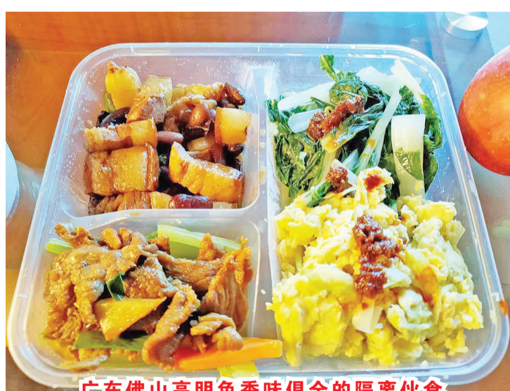
广东佛山高明色香味俱全的隔离伙食