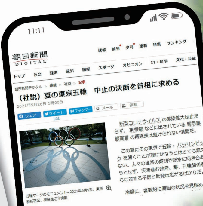
●《朝日新聞》社論引起極大迴響。網上圖片